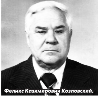
Феликс Казимирович Козловский.