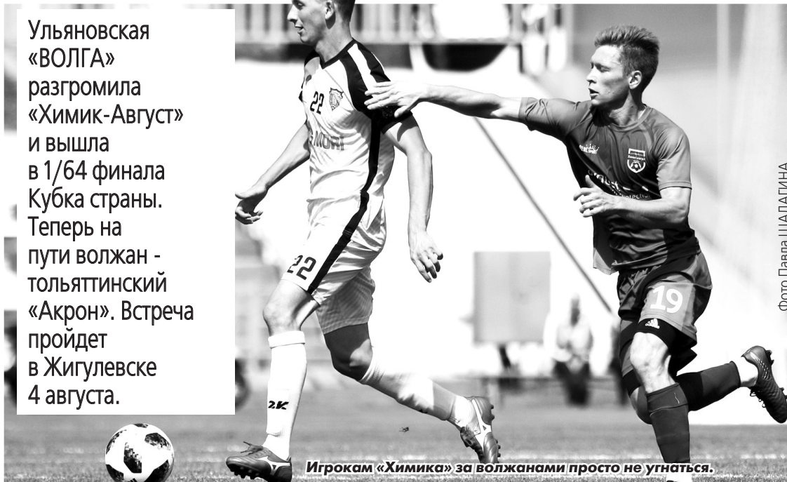
Игрокам «Химика» за волжанами просто не угнаться.

Ульяновская «ВОЛГА» разгромила «Химик-Август» и вышла в 1/64 финала Кубка страны. Теперь на пути волжан - тольяттинский «Акрон». Встреча пройдет в Жигулевске 4 августа.