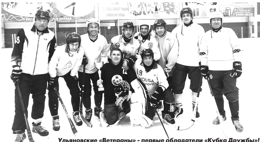
Ульяновские «Ветераны» - первые обладатели «Кубка Дружбы»!

Итоговая таблица. 1. Ветераны - 9 очков (разница мячей: 15-9), 2. СПК - 6 (15-11), 3. Союз - 3 (14-18), 4. Медведи - 0 (16-22).