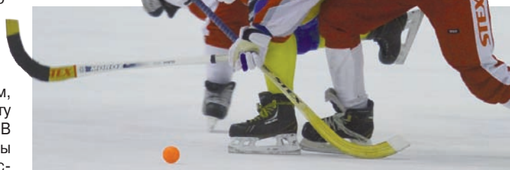
Мальчишки сражались, как взрослые.