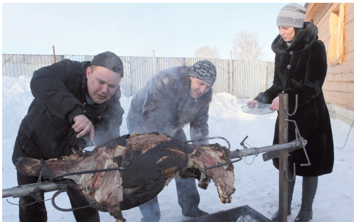
Чуваши - хлебосольный народ: специально для гостей зажирили барана.

Так, Ульяновск ездил за опытом в Оренбург. Здесь культурную деревню начали возводить аж с 2005 года. Сейчас поле, когда-то заросшее бурьяном, представляет собой целый комплекс для семейного отдыха. Здесь свои постройки возвели десять автономий. Фонтаны, скамейки, замки, скульптуры, музеи, кафе с кухнями различных народов мира - оренбуржцы сотворили настоящий национальный ансамбль. Возможно, в скором времени такой колорит ждет и родину Ленина.