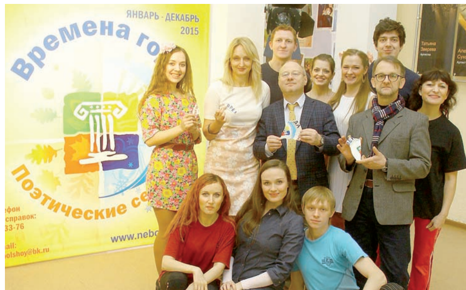
В «Nebolshom театре» рождается много красивых идей.

...Слушала эти и другие вроде бы знакомые с детства стихотворные строки и в очередной раз убеждалась - как скучно нам было бы жить без поэзии. Давно сказано: вначале было слово. Начните свой завтрашний день с поэтического слова. Поверьте: если вы хотите подняться над бытом и суетой, если хотите дотянуться до бытия - читайте стихи!