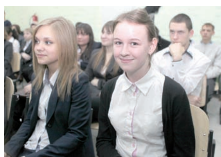
Школьникам дали возможность выбрать.

В то же время глава региона подчеркнул, что и само высшее образование не должно являться самоцелью как для выпускников, так и для их родителей. Ведь никто не говорит, что человек, окончивший техникум или колледж, не сможет в дальнейшем найти себя в жизни. Напротив, современные реалии говорят об обратном - старшее поколение рабочих и тружеников села планомерно уходит на пенсию. Все острее встает необходимость прихода им на смену молодых кадров. Поэтому чем дальше, тем нужнее будут региональной экономике токари, слесари, фрезеровщики, учитывая при этом, что в регион приходят все больше инвесторов, строящих промышленные предприятия.