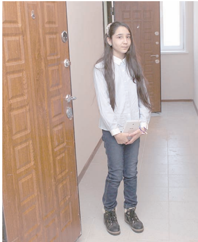
Из ветхого жилья начали переселять.

Предложено и больше брать пример с регионального правительства. Например, перед тем, как главе района и главе администрации подписать какой-либо документ, его нужно обсудить с общественностью и со специалистами. Также высказана инициатива за каждым сельским поселением закрепить кураторов из руководства района по аналогии с областным правительством в отношении районов.