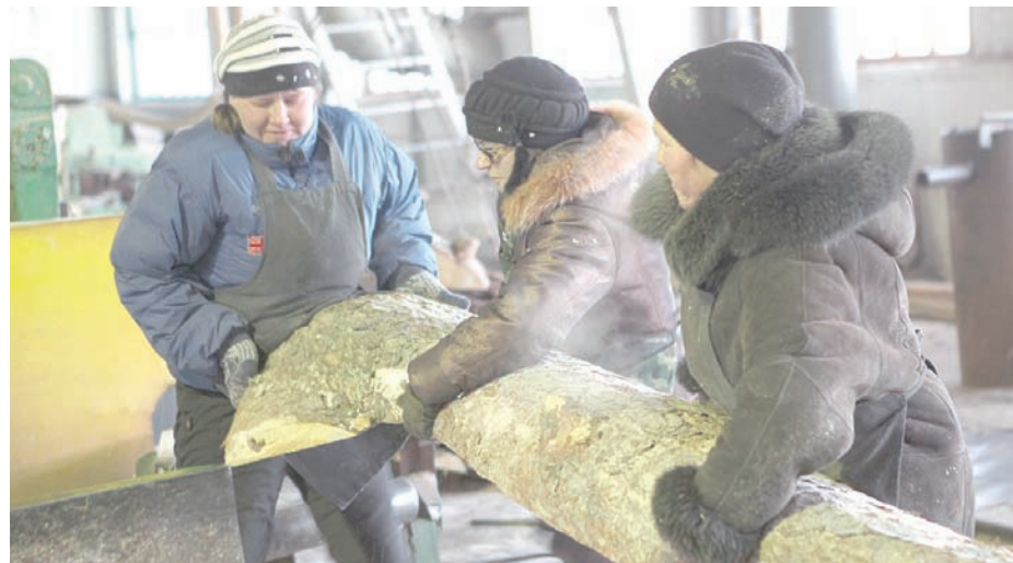
В лесной отрасли региона работают около 7 000 человек.

изменилось, и сейчас, по словам руководства предприятия, прокуратура требует остановить производство на территории леса. Основание тому - требование Лесного кодекса в редакции 2007 года. Однако закрыть лесхоз - значит остановить градообразующее предприятие Вешкайма и оставить без работы не один десяток человек.