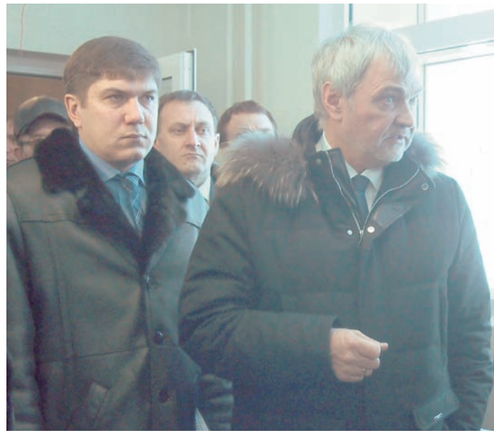
Федеральные и региональные власти работают совместно для улучшения медицинского обслуживания димитровградцев.

- Объект крайне сложный: ничего подобного не проектировалось ранее в нашей стране, в связи с этим возникают задержки из-за технических проблем, связанных с соблюдением норм ядерной безопасности, которые периодически ужесточаются и изменяются. Ежегодно мы тратим порядка 34 миллиардов рублей на лечение пациентов с онкологическими заболеваниями. Объем инвестиций в данный проект - 19 миллиардов рублей. Таким образом, открыв центр, мы не только сохраним жизни пациентов, но и существенно сократим расходы, чтобы направить высвободившиеся средства на развитие других важных направлений отрасли.