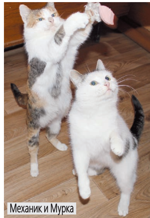
Механик и Мурка

Присылайте фото питомца по адресу: 432017, г. Ульяновск, ул. Пушкинская, 11. Фото можно присылать также на электронную почту: glavrednarod@mail.ru. Не забудьте указать в письме ФИО, ваши контакты, как зовут вашего кота или кошку и рассказать пару слов про любимца.