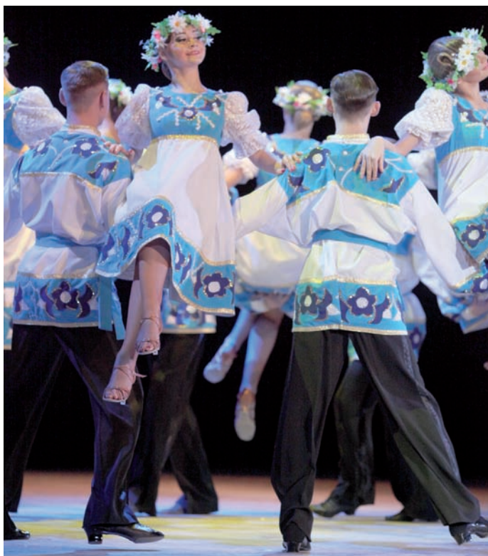
Народный танец в исполнении взрослой группы ансамбля.