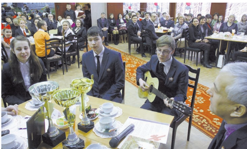
Школьники спели для губернатора свою походную песню.

Проект появился два года назад и постепенно набирает обороты. Напомним, смысл движения в том, чтобы взять из старого пе-