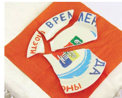
«Кусочки счастья» от тарелки с логотипом фестиваля.