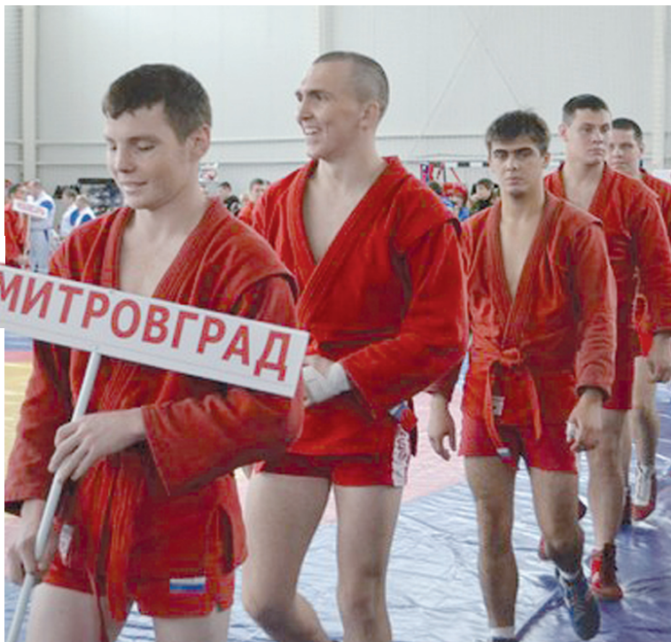
В этом году во всероссийском турнире по самбо приняли участие 103 спортсмена из 15 регионов страны!

В этом году во всероссийском турнире по самбо приняли участие 103 спортсмена из 15 регионов страны! Больше всего участников приехало из близлежащих регионов – Нижнего Новгорода, Самары. Разместить такое количество спортсменов накануне состязаний удалось вблизи от спорткомплекса – в местном профилактории и двух гостиницах.