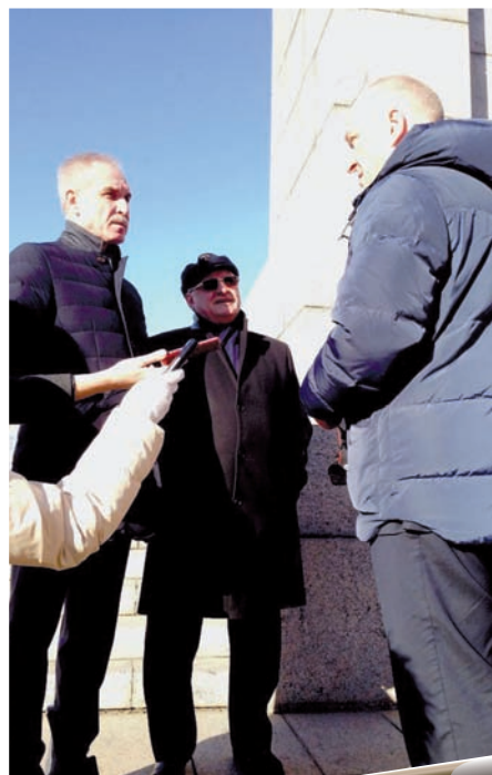
Подготовили Дмитрий ЧУРОВ, Павел ШАЛАГИН

Дойдет очередь и до самой площади Ленина, которая не ремонтировалась 50 лет. Глава региона сказал, что ее ремонтом займутся после того, как будет реконструирована площадь 30-летия Победы.