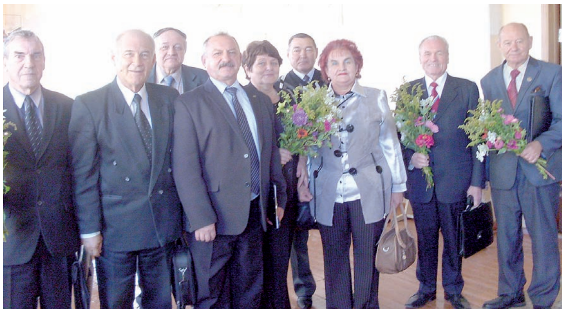
Председатели советов ветеранов войны и труда Старомайнского, Чердаклинского, Мелекесского, Новомалыклинского районов и Дмитровграда обсудили подготовку к 70-летию Победы.

Участники заседания побывали в селе Ореховка, где установлен памятник жертвам