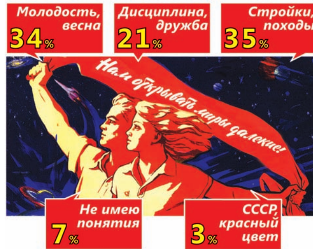
Инфографика Юлии МАСЛИХОВОЙ

Сегодня день рождения ВЛКСМ, и, несмотря на то что больше двадцати лет мы живем в государстве, в политику которого не вписывается комсомол, для большинства представителей старшего поколения этот день что-то да значит. Молодость, дружба, стройки – что бы это ни было, понять можно только родившимся в СССР. Для нового поколения комсомол в лучшем случае – просто красный цвет.