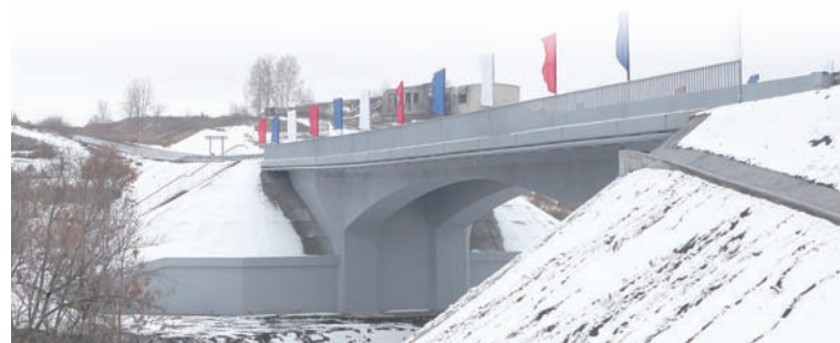
Мост строили по немецкой технологии.

К слову, православный центр в Сурском будет логически связан с парком, посвященным православию, который планируется создать в Ульяновске. Он же, в свою очередь, будет тесно переплетен с уже существующим сквером Духовности. То есть таким образом будет прочерчена своеобразная линия от современного православия в Ульяновске к его истокам в Сурском.