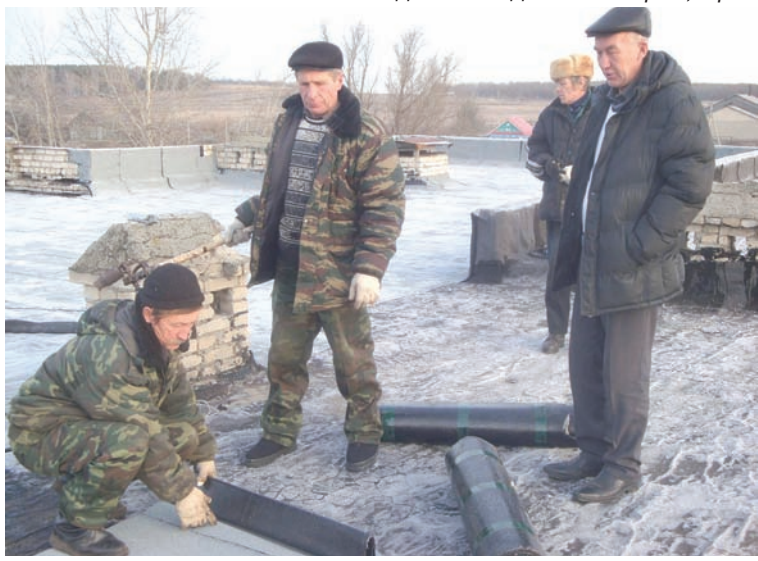
Водопровод протяженностью в 3 км, как предполагается, будет запущен до наступления зимы!