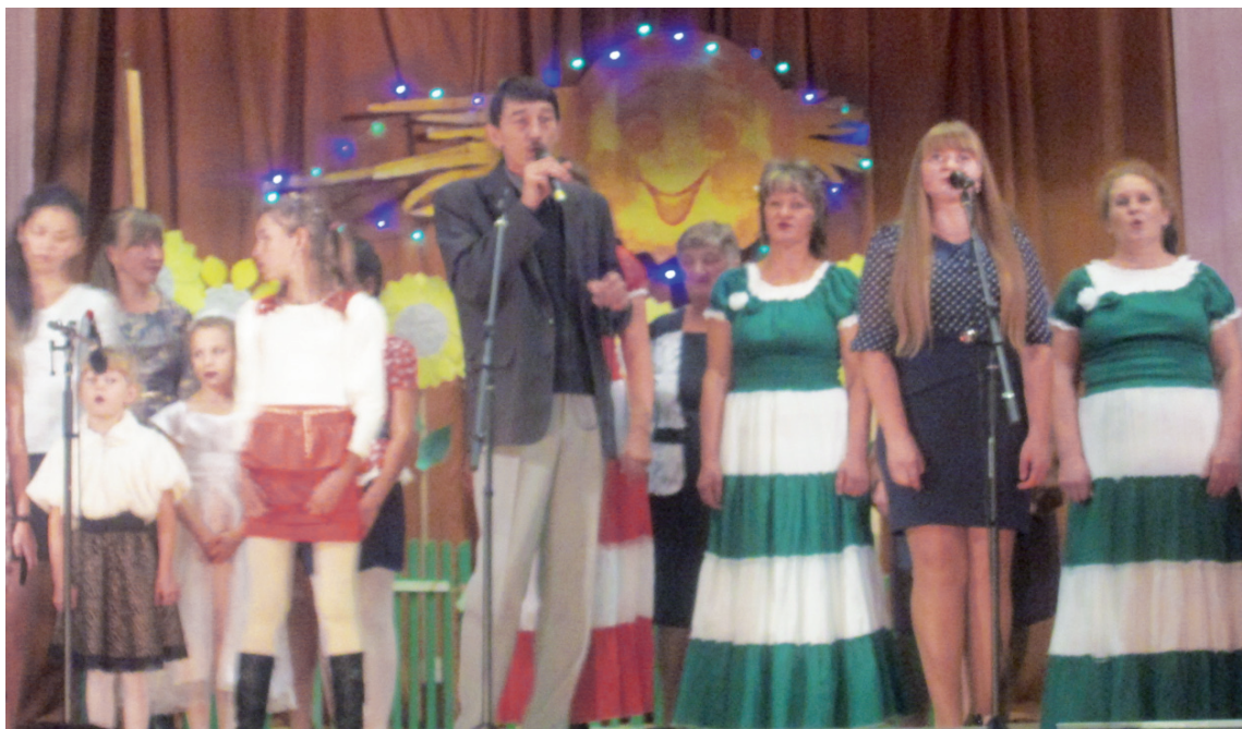
Песни действительно звучали от души, а все потому, что пели родные друг другу люди.

На сцене, кстати, было много и мужчин: они, как правило, реже принимают участие в подобных мероприятиях и менее склонны к творчеству. А тут вышли поддер-