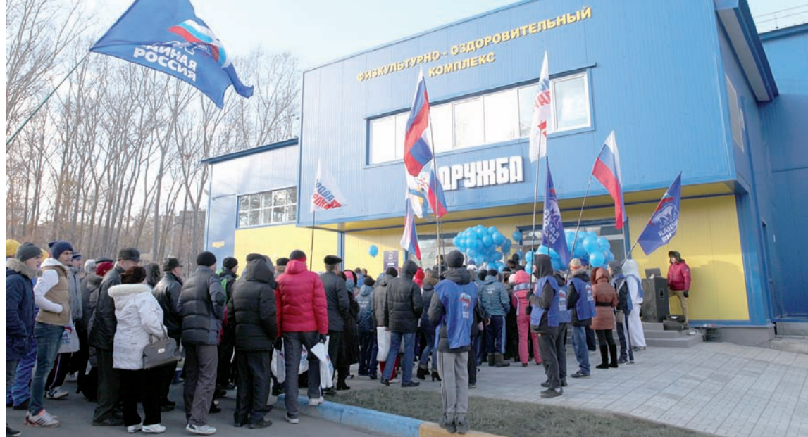
На новый ФОК захотели посмотреть все!

более 40 спортивных объектов в регионе потрачено более 6 миллиардов рублей. За последние 7 лет в области построено больше спортсооружений, чем за предыдущие 40 лет. 120 тысяч спортсменов области участвуют в соревнованиях различного уровня (в 2004 году их количество не достигало и 50 тысяч). 220 тысяч детей занимаются в спортивных секциях (в 2004-м – 151 тысяча).