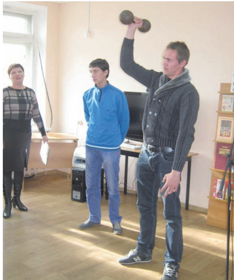
Радищевцы сдают нормы ГТО.