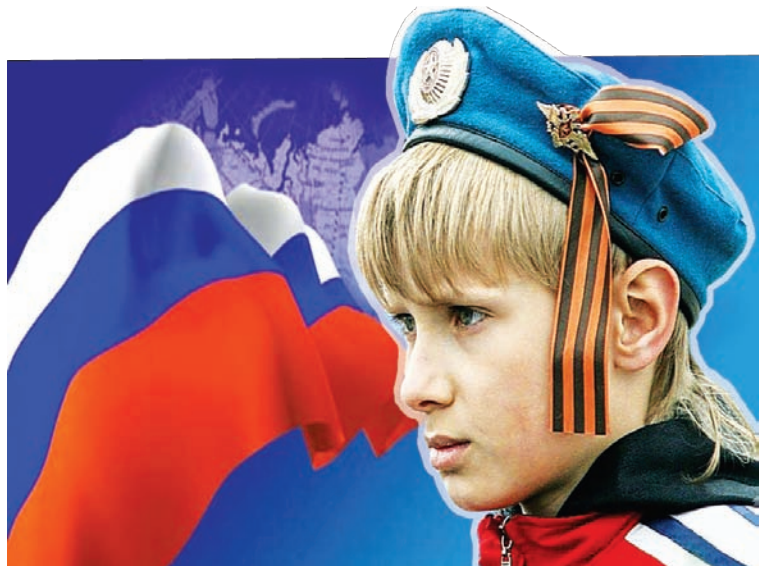
Коллаж Юлии МАСЛИХОВОЙ

Принят он должен быть еще до конца этого года. Озвученные идеи в общем-то просты, их реализация, по мнению Сергея Морозова, позволит повысить уровень патриотизма. В частности, губер-