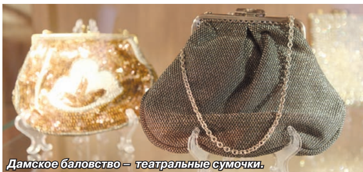
Дамское баловство – театральные сумочки.

И помните: сумка для женщины, как утверждают психологи, это ее интимное пространство. Потому сумка обязательно закрывается, прячет некоторые тайны хозяйки. Не спешите разгадывать все эти тайны.