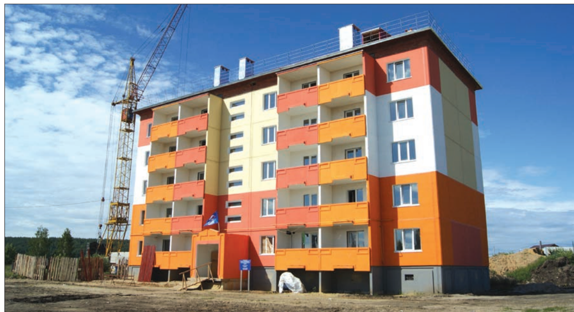
Строительство нового микрорайона идет полным ходом.

Отремонтированы с укладкой нового асфальтобетонного покрытия автомобильные дороги общей протяженностью 6,2 км в шести населенных пунктах района. В г. Барыше отремонти-