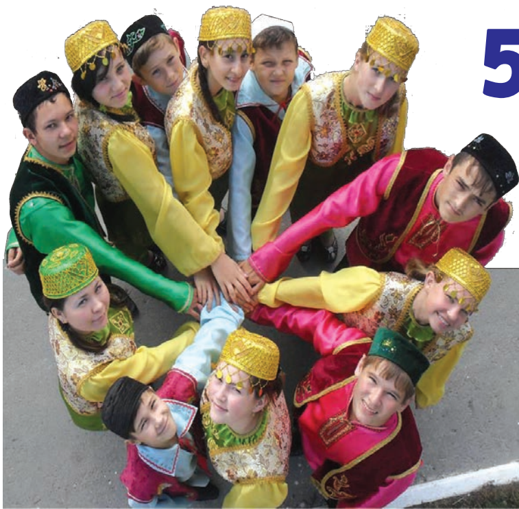
Для них школа стала началом пути в мир профессиональной музыки.

стала началом пути в мир профессиональной музыки. Именно этому обучают в стенах Старокулаткинской детской школы искусств.