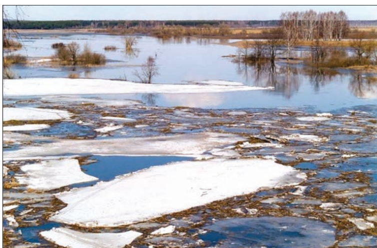
Лед тронется по расписанию.

Учитывая данные за 43-летний период, спасатели прогнозируют в третьей декаде марта и в первой декаде апреля подтопления жилых домов от разлива рек на территориях шести муниципальных образований, частично в