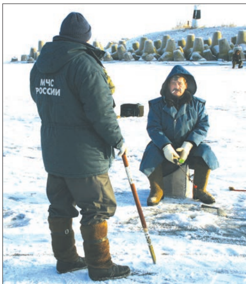
Любителям рыбалки нужно быть особенно внимательными.

Учитывая данные за 43-летний период, спасатели прогнозируют в третьей декаде марта и в первой декаде апреля подтопления жилых домов от разлива рек на территориях шести муниципальных образований, частично в 20 населенных пунктах. В опасную зону во всем регионе могут попасть 348 жилых домов с населением 1 041 человек,