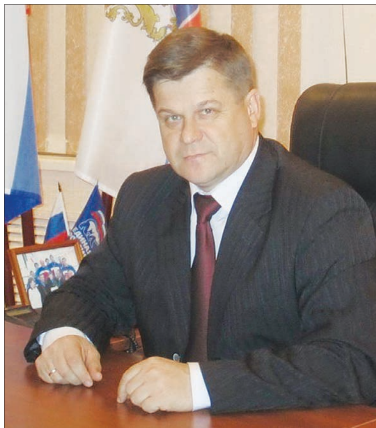
Глава района уверен: очередей больше не будет.

– На сегодня мы можем сказать, что проблема очередей в