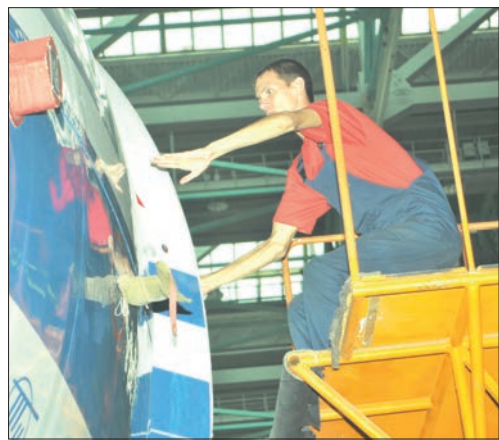
«Авиастар» силен поддержкой ветеранов.

– Программа на предприятии уже прижилась, она действует с 2011 года и направлена