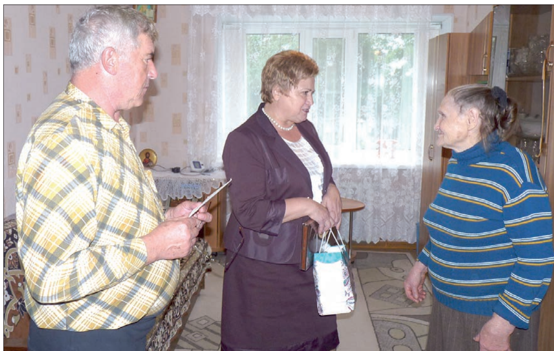
Социальная защита пожилых людей – приоритет региональной политики.

В 2013 году на программу «Забота» из областного бюджета было выделено 5,88 млрд. рублей. Она позволила систематизиро-