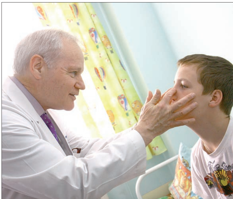
Узкие специалисты переживают, будут ли их ждать пациенты.

Так, в одном из писем сказано: «Поликлинику ликвидируют. Есть информация о том, что детскую поликлинику №1 присоединяют к детской поликлинике №3, которая находится на