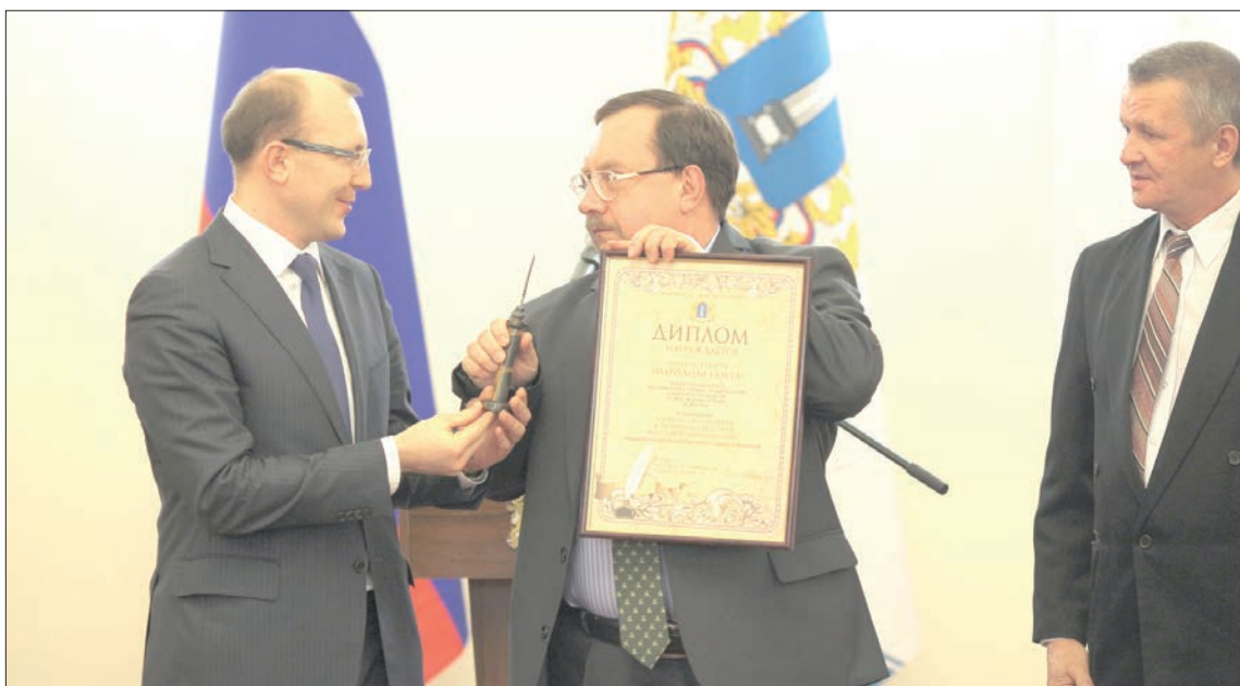
«Народку» премировали за цикл статей о героях войны и труда Ульяновской области.

Русский человек славится своим умением находить выход из самых трудных ситуаций, но еще более он славится своим умением находить туда вход.