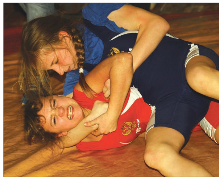
На ковре шла ожесточенная борьба.

кому еще нужно время, чтобы посоревноваться с более опытными. Для многих он знаковый, потому что готовит на будущее новую смену борцов и является своего рода трамплином в мир серьезного спорта.