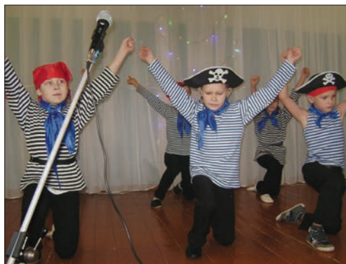
На бал приехали около ста юных талантов.

Отлично подготовились юные артисты вместе с педагогами и родителями. Все вы-