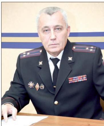
«Мы сохранили тесную связь с ветеранами отдела».

никла необходимость обеспечения безопасности на вокзалах и в поездах. Тогда и появились наши далекие предшественники – жандармы полицейских управлений, которые следили за порядком на железной дороге.