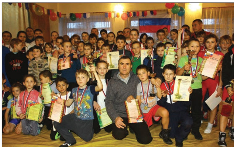
Спортсмены с заслуженными наградами.

Как говорят спортсмены и тренеры, турнир в Цильнинском районе – это всегда возможность увидеть сильных и тех,