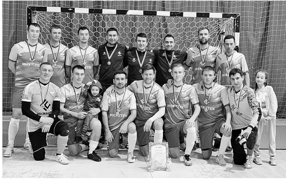
«Май Медиа» заслуженно стала лучшей командой Высшей лиги сезона - 2022/2023.

МЕТА-УЛЬЯНОВС-РЕГТАЙМ - СМЕНА - 1:2 (0:1)