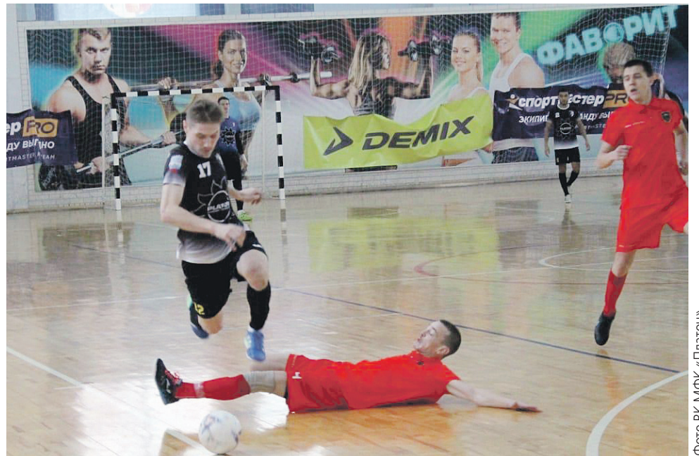
Футболисты «Платона» и «Икса» по полю летали - поэтому много забивали.