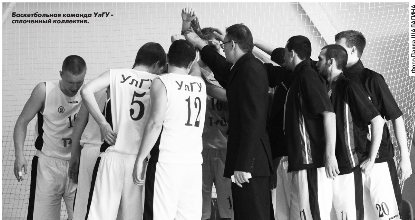
Баскетбольная команда УлГУ - сплоченный коллектив.