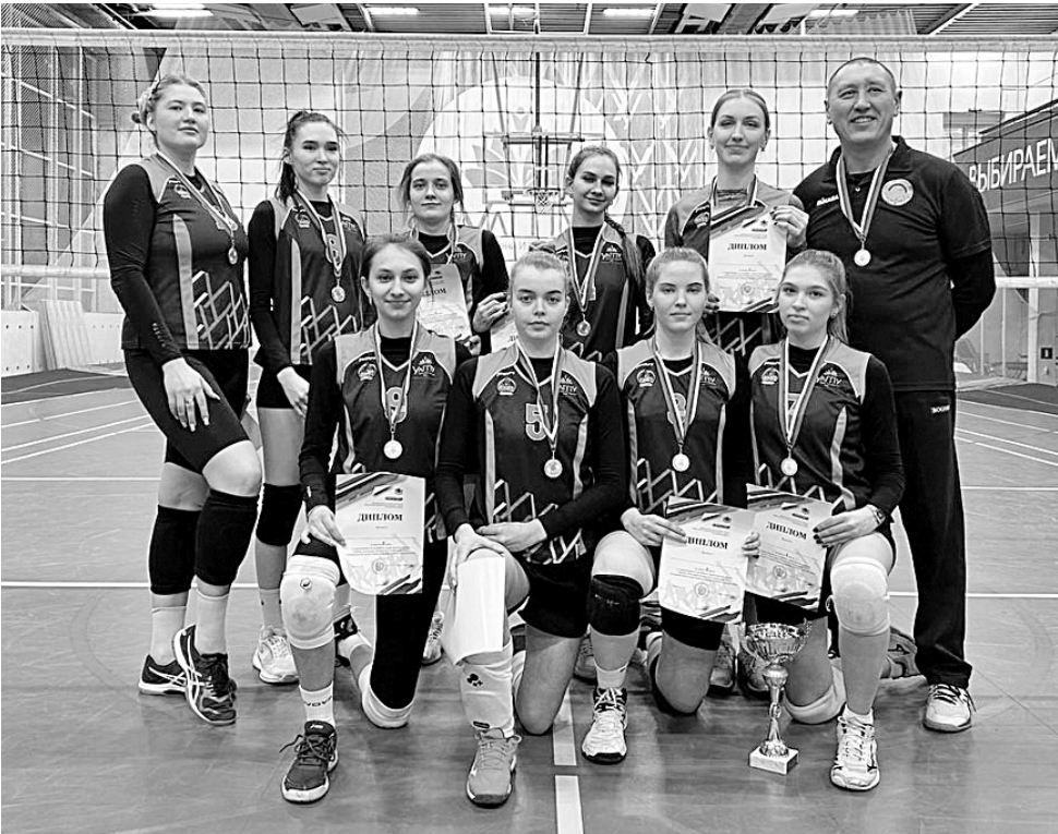
Женская команда УлГПУ третий год подряд никому не отдает пальму первенства в студенческом волейболе.

- Это была игра, достойная финала, - рас-