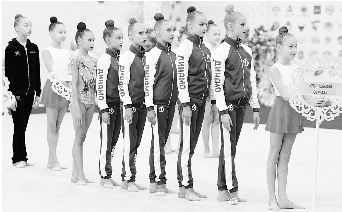
Даже на церемонию открытия первенства ПФО ульяновская команда вышла полностью сосредоточенной.

По правилам соревнований каждый из 14 регионов ПФО мог выставить по десять гимнасток. На правах проводящей стороны Ульяновск получил право добавить еще трех спортсменок. Хозяйки помоста, конечно, этим воспользовались и не прогадали. Все 13 ульяновских гимнасток завоевали право участвовать в финале многоборья. При этом