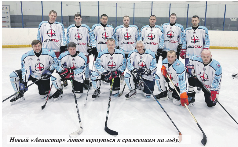
Новый «Авиастар» готов вернуться к сражениям на льду.