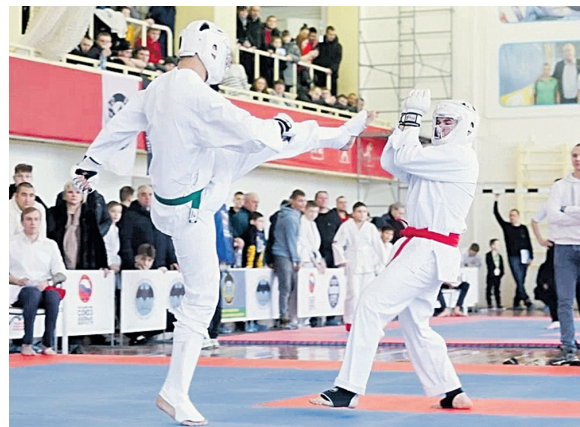
Атака против защиты. Чья возьмет?

Около двух сотен участников из клубов Ульяновска, Цильнинского, Чердаклинского, Инзенского, Базарно-сызганского, Карсунского и Ульяновского районов оспаривали медали в разделе «Поединки со средствами защиты» (СЗ). В программе чемпионата высшие награды девяти весовых категорий распределились между бойцами шести клубов.