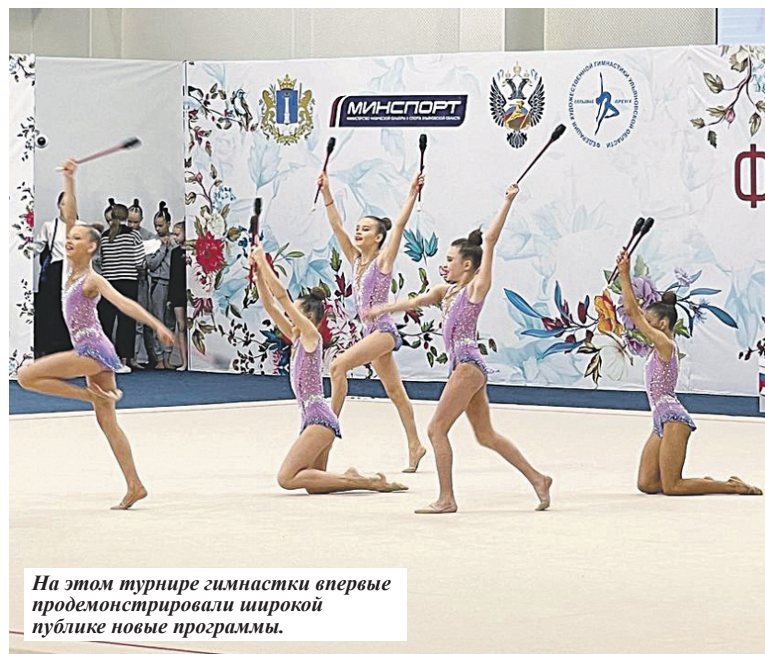
На этом турнире гимнастки впервые продемонстрировали широкой публике новые программы.

По итогам соревнований была сформирована региональная сборная для выступления на чемпионате и первенстве ПФО. В марте окружные турниры примет Саратов.