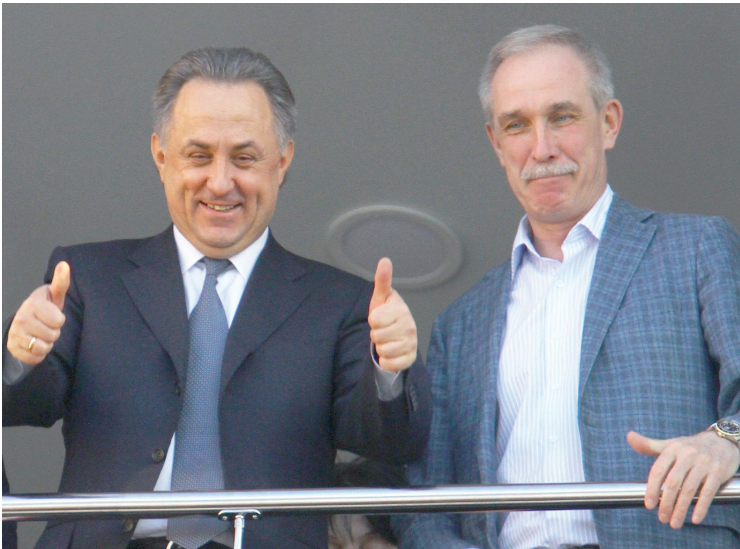
Виталий Мутко (слева): «Ульяновск, все - супер!».