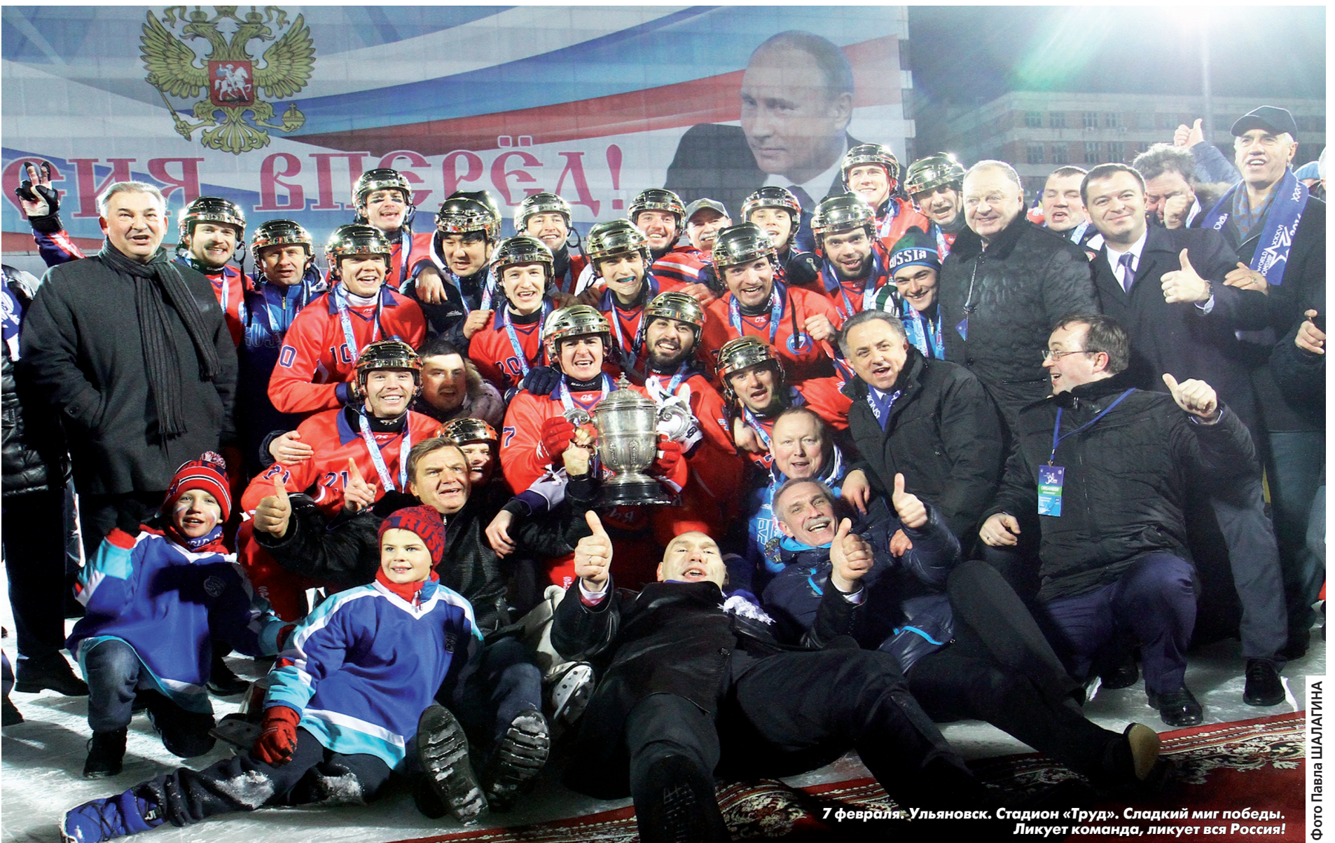
7 февраля. Ульяновск. Стадион «Труд». Сладкий миг победы. Ликует команда, ликует вся Россия!

Впервые в новейшей истории сборная РОССИИ завоевала четвертое «золото» подряд на чемпионатах мира.