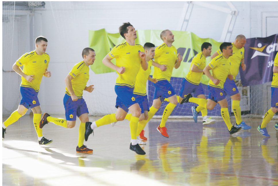
Команда «Погода в доме» мчится ко второму Суперлиговскому «золоту» подряд.

Мы полностью владели игровым преимуществом, но пропускали необязательные мячи. Во втором круге стараемся не допустить таких ошибок и взять реванш. Мастерства, чтобы стать чемпио-