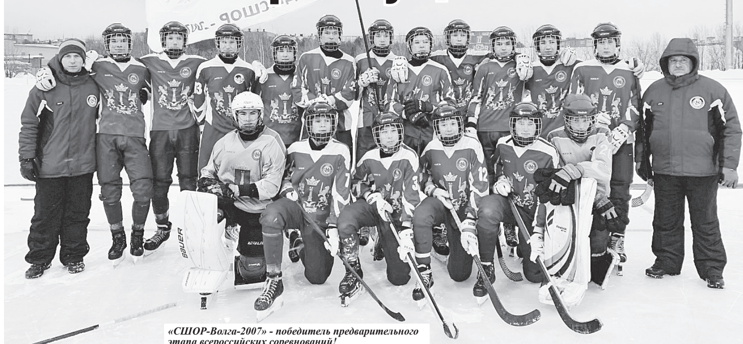
«СШОР-Волга-2007» - победитель предварительного этапа всероссийских соревнований!