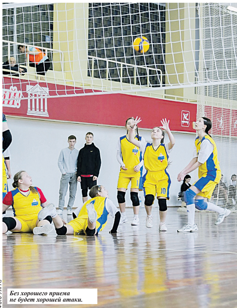
Без хорошего приема не будет хорошей атаки.