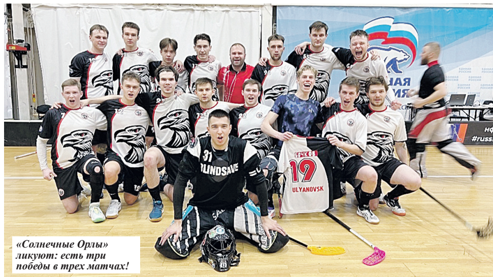
«Солнечные Орлы» ликуют: есть три победы в трех матчах!

Воспользовавшись осечкой «ветлужцев», «Орлы» догнали их в турнирной таблице, но остаются на втором месте из-за поражения