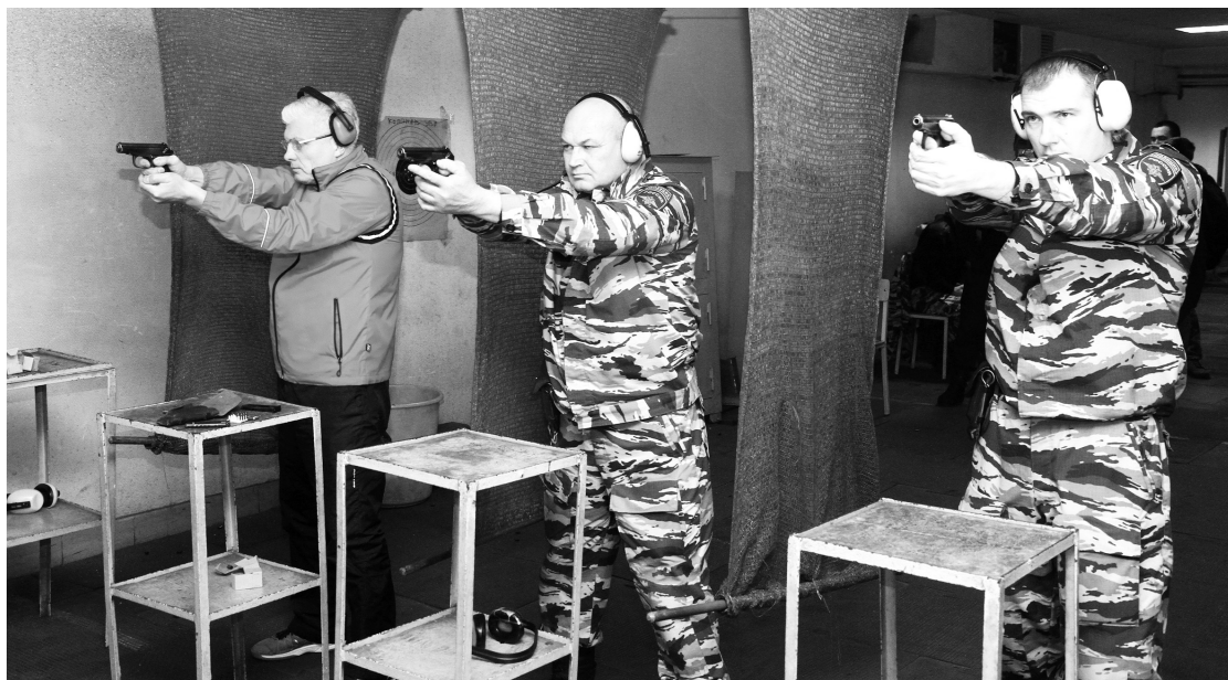
Стрельба из пистолета Макарова - конек ульяновских омонцев.