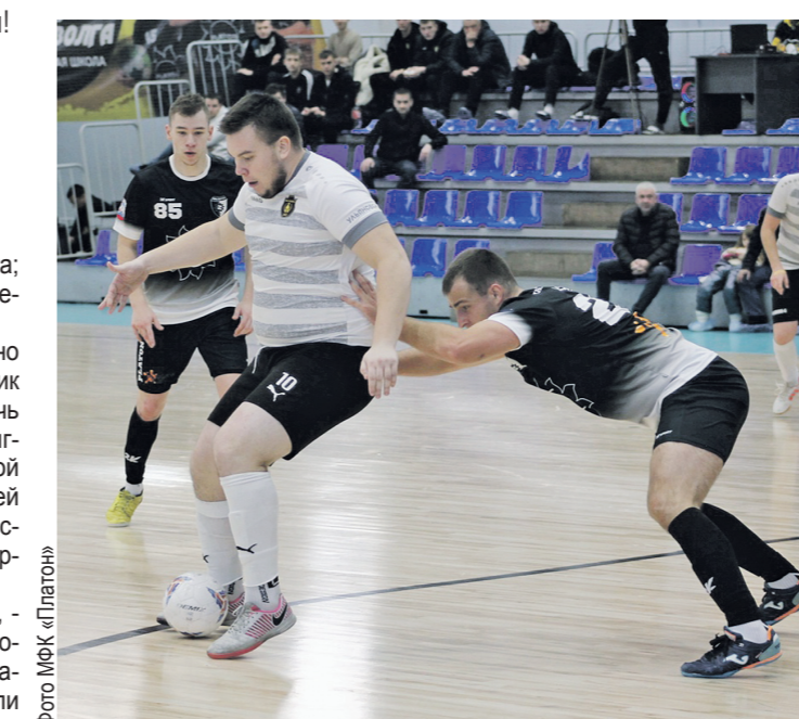
«Олимп-С» казался глыбой для молодых игроков «Платона», но они не ступивались и одержали уверенную победу.

нам повезло. Но это везение еще надо заслужить. Считаю, что мы провели неплохой матч и победили в целом заслуженно.