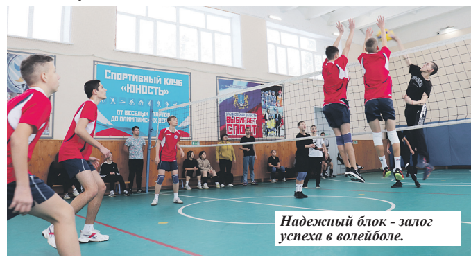
Надежный блок - залог успеха в волейболе.