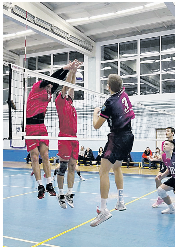
Блок - один из главных козырей ульяновского «Динамо» в этом сезоне.