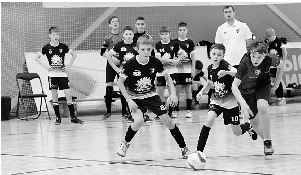
По азарту игры у юношей не уступают матчам взрослых.

Платон-Волга-Цильна - ДШФ Динамо - 9:2, Платон-Волга-девочки-62 - Орлан - 1:6, Волга-девочки - Квадрат - 3:1. U13. «Город»: ДШФ Динамо - Юниор - 2:6, Свияга - Ква-драт - 9:0, Импульс - Платон-Волга-Сборная - 3:7, Платон-Волга-Цильна - Бирюч - 2:6, Сура - Волга-девочки - 0:1. «Юг»: Кулатка - Радищево - 2:1, Спартак-2 - Спартак - 0:6, ДЮСШ (Николаевка) - Кулат-ка - 3:8, ДЮСШ-2 (Николаев-ка) - Радищево - 0:4, Кулатка - Спартак - 0:15.