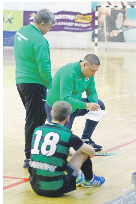
Тайм-ауты «ПСК» всегда и эмоциональны, и плодотворны.

Шансы «Кристалла» в этом матче расценивались как невысокие. И после шести минут игры показало, что «Погода» одержит очередную уверенную победу. Но «кристаллические» перевернули все с ног на голову.