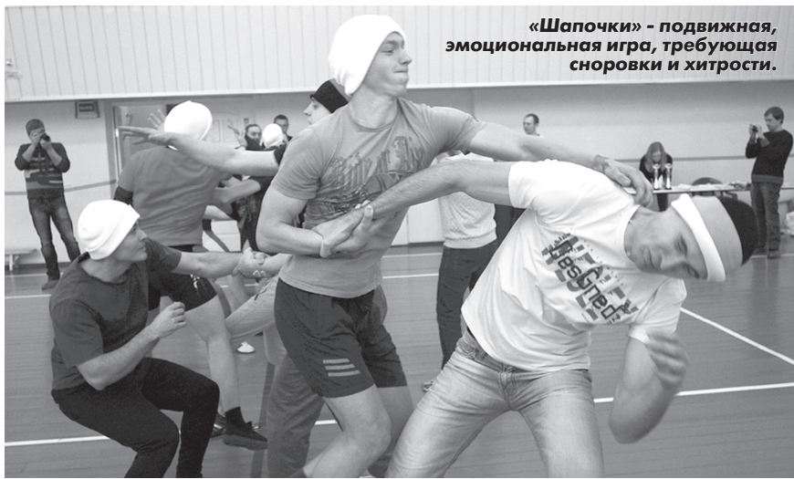
«Шапочки» - подвижная, эмоциональная игра, требующая сноровки и хитрости.

спортсменов не старше 30 лет. В итоге командную победу одержала дружина «Витязи». Серебряным призером «Эстафеты», поразив всех национальными костюмами, стали спортсмены команды «Казачий дозор».