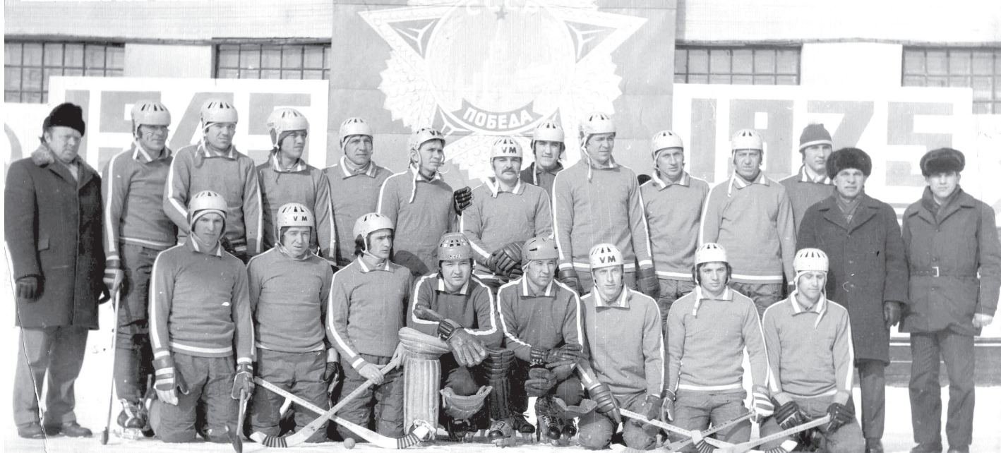
«Волга» - бронзовый призер чемпионата СССР сезона-1975-1976 гг.