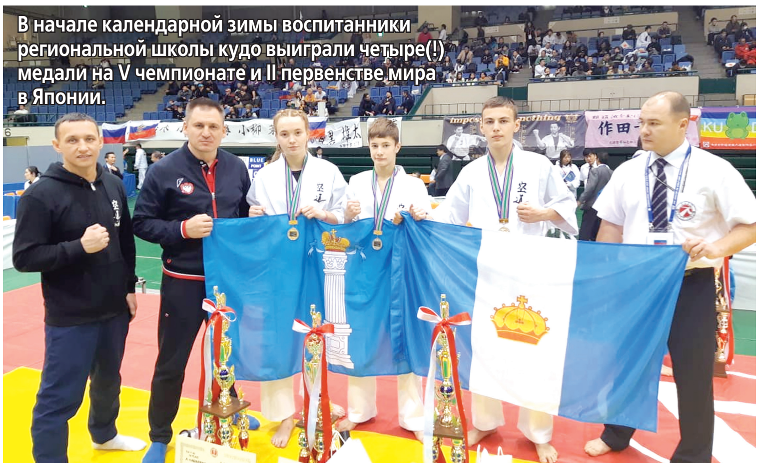
В начале календарной зимы воспитанники региональной школы кудо выиграли четыре(!) медали на V чемпионате и II первенстве мира в Японии.