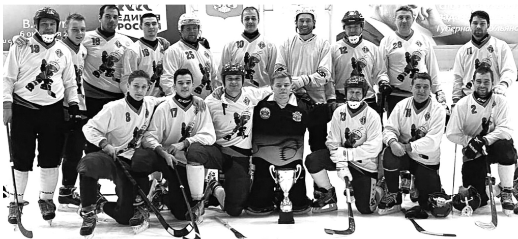
Команда «Метеор» - обладатель Кубка Ульяновской области!

В начале декабря УИ ГА и «Метеор» вновь сыграют друг против друга. На этот раз команды поборются за Суперкубок области.