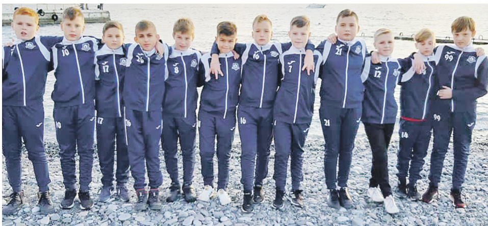
Прогулка по берегу Черного моря обязательна, если побывал в Сочи. «Университет-95» не стал менять эту традицию.