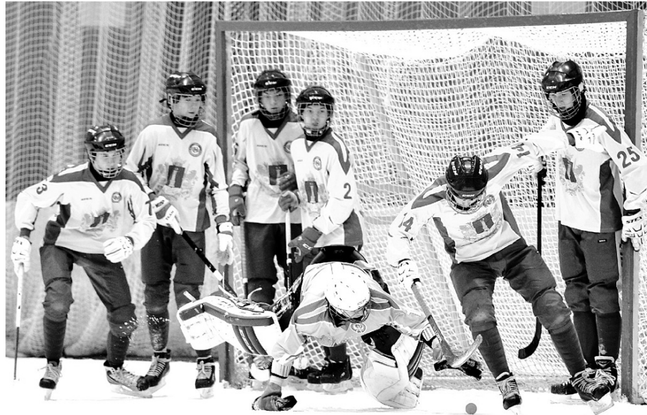
Один за всех и все за одного! Такого девиза придерживается «СШОР-Волга-2007»!

- В первом тайме безобразно отыграли в обороне («СШОР-Волга-2006» уступала 1:5),