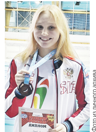
Фото из личного архива