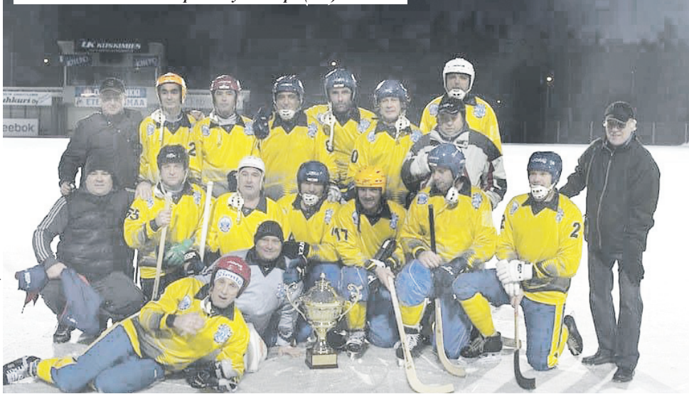
Ноябрь 2011 года. Лаппеэнранта. Ветераны ульяновской «Волги» - обладатели первого Кубка мира (45+).