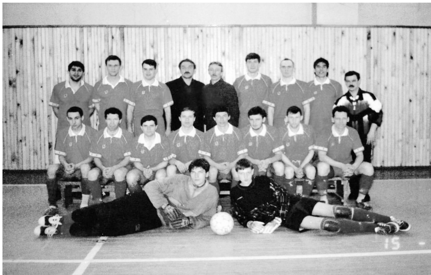
1998 год. «Авангард» - первый в истории чемпион Ульяновской области по мини-футболу.