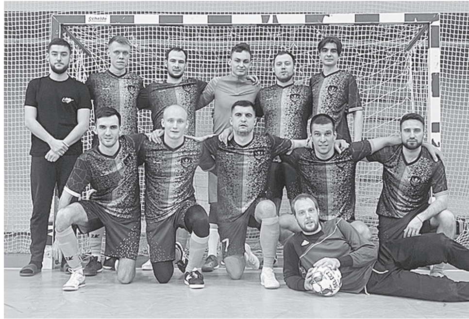
Несмотря на статус новичков, «Нефтяник» намерен бороться за медали Высшей лиги.