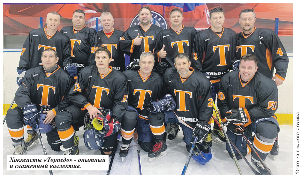
Хоккеисты «Торпедо» - опытный и слаженный коллектив.