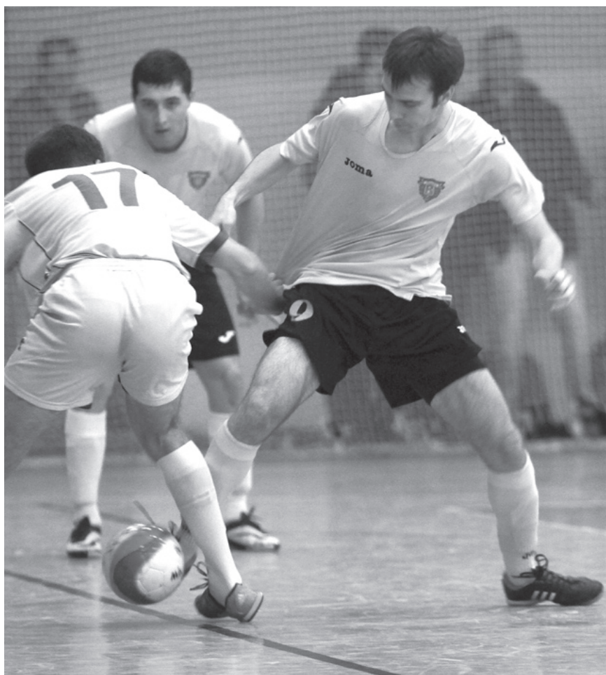
«Кристалл» против «Волги-Каймана» играл на грани фола и добился ничьей - 1:1.