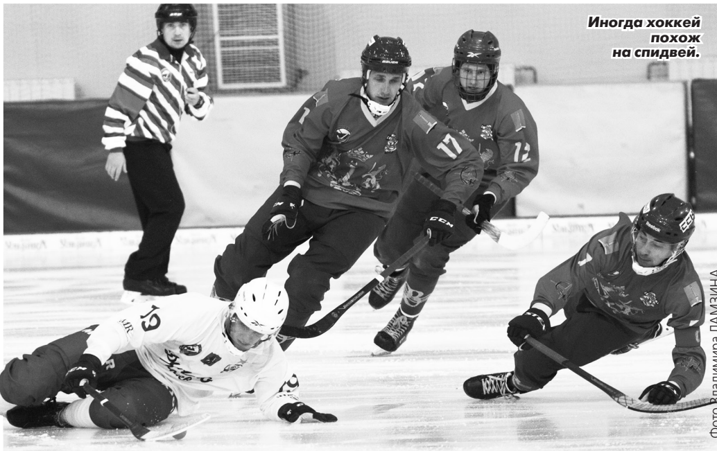
Иногда хоккей похож на спидвей.

Голы: Башаев (Галаутдинов), 17 - с углового; Ничков, 18 (2:0); Филиппов, 25 (2:1); Ничков (Ишкельдин), 32 - с углового (3:1); Иванов, 40 (3:2); Тургунов, 49 (4:2); Щеглов, 51 - со штрафного, 54 - с 12-метрового; Барбаков, 77; Василенко, 79 - с углового; Барбаков, 81, 89 (4:8). Нереализованный 12-метровый: Тарасов (Д), 47 - вратарь. Штраф: 40-10.