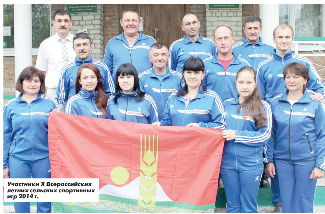
Участники X Всероссийских летних сельских спортивных игр 2014 г.

■ В небольшом селе Мосеевка есть школа, где учатся всего 20 детей, зато все умеют играть в волейбол. Причем не абы как. Местная команда заняла второе место в областном турнире и участвовала во всероссийских соревнованиях.