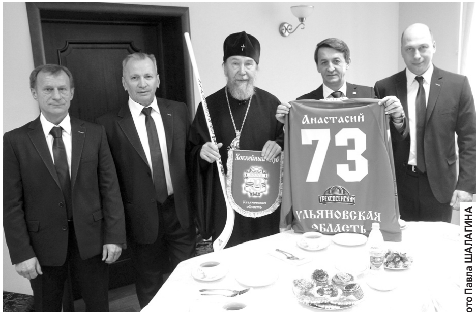
Митрополит Анастасий пополнил ряды болельщиков «Волги».

Во втором тайме Максим Пахомов оформил дубль и довел свой голевой счет до 300 мячей за карьеру. Хочется верить, что уже в следующей игре такого же рубежа достигнет и капитан «Волги» Игорь Ларионов - сейчас у него 299 мячей.