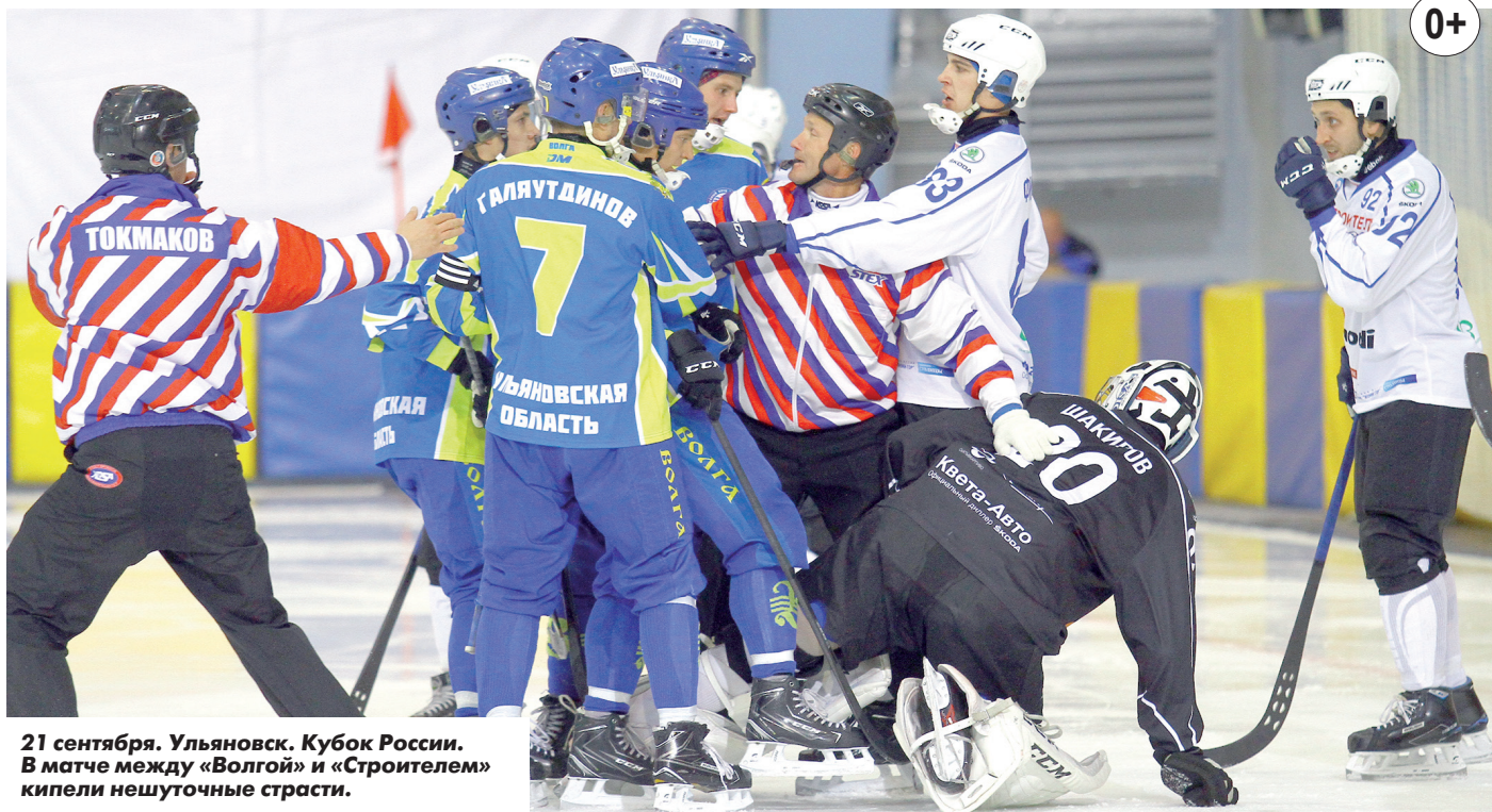
21 сентября. Ульяновск. Кубок России. В матче между «Волгой» и «Строителем» кипели нешуточные страсти.

В понедельник, 11 ноября, в Ульяновск придет большой хоккей. В домашнем матче-открытии XXVIII чемпионата России ульяновская «ВОЛГА» примет сыктывкарский «Строитель».