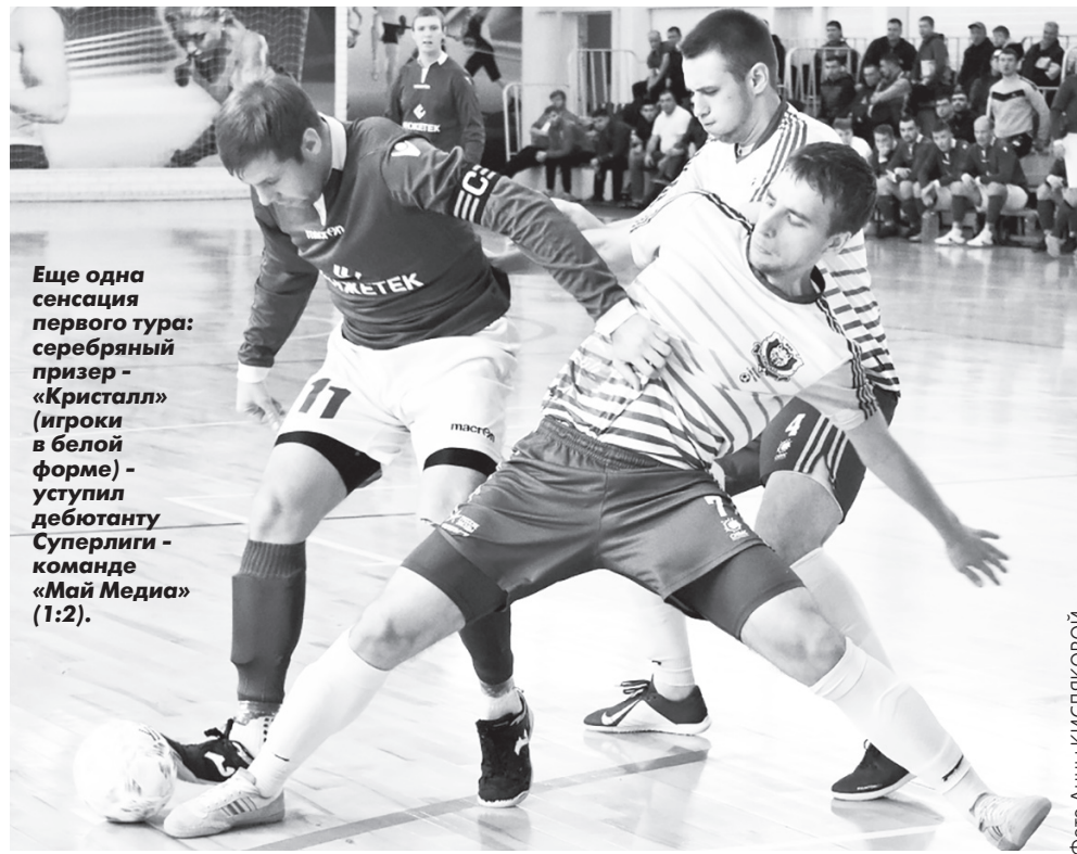
Еще одна сенсация первого тура: серебряный призер «Кристалл» (игроки в белой форме) - уступил дебютанту Суперлиги - команде «Май Медиа» (1:2).