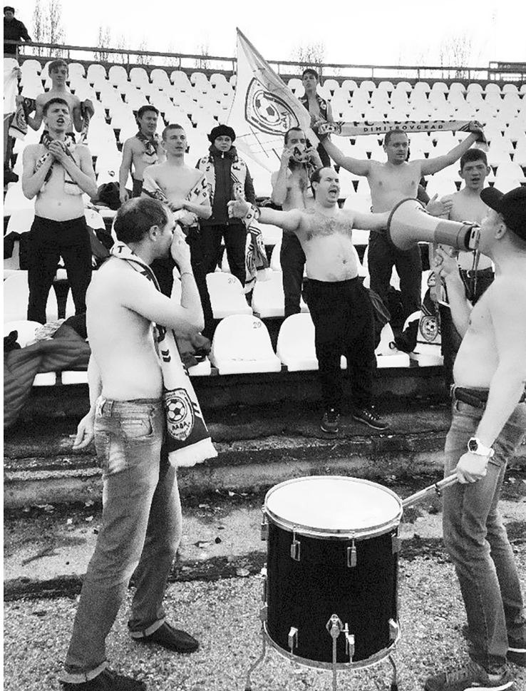
Фанаты димитровградской «Лады» вместе с командой как в трудные, так и в радостные минуты.