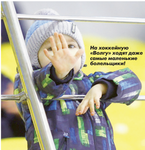
На хоккейную «Волгу» ходят даже самые маленькие болельщики!