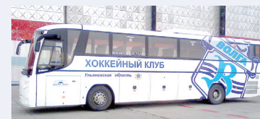
Анонс игры со «СКА-Нефтяником» - на стр. 4.

Вчера вечерним поездом ульяновская команда отправилась в столицу на финальный этап Кубка страны. Уже в Москве «Волгу» встретит собственный автобус, который теперь обрел клубную расцветку.