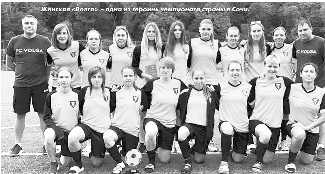
Женская «Волга» - одна из героинь чемпионата страны в Сочи.