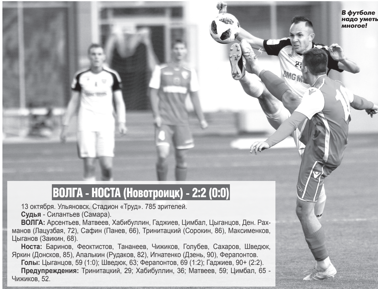
В футболе надо уметь много!