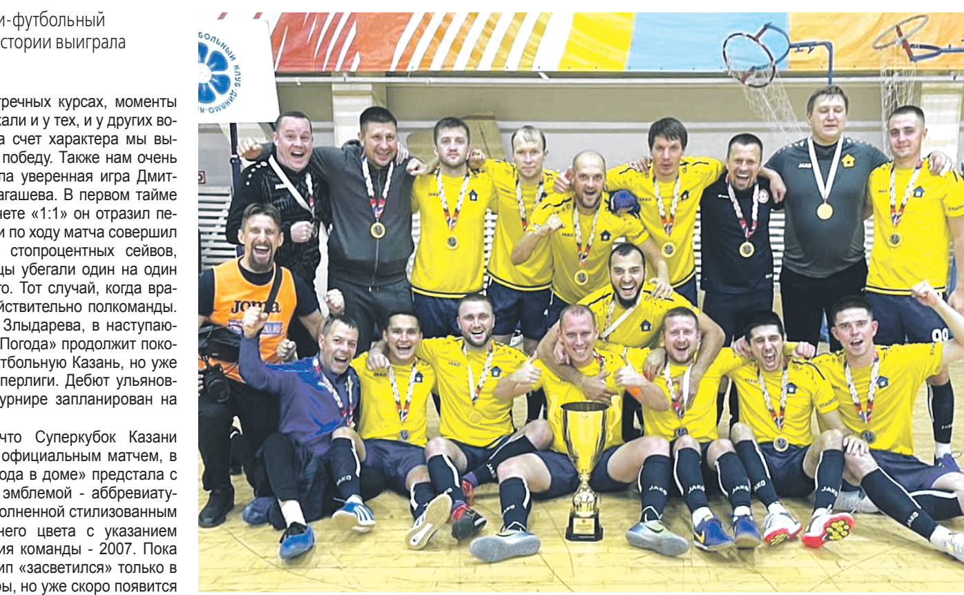
«Погода в доме» выиграла и Суперкубок Казани.