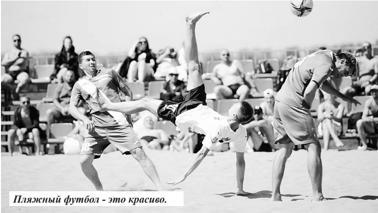
Пляжный футбол - это красиво.