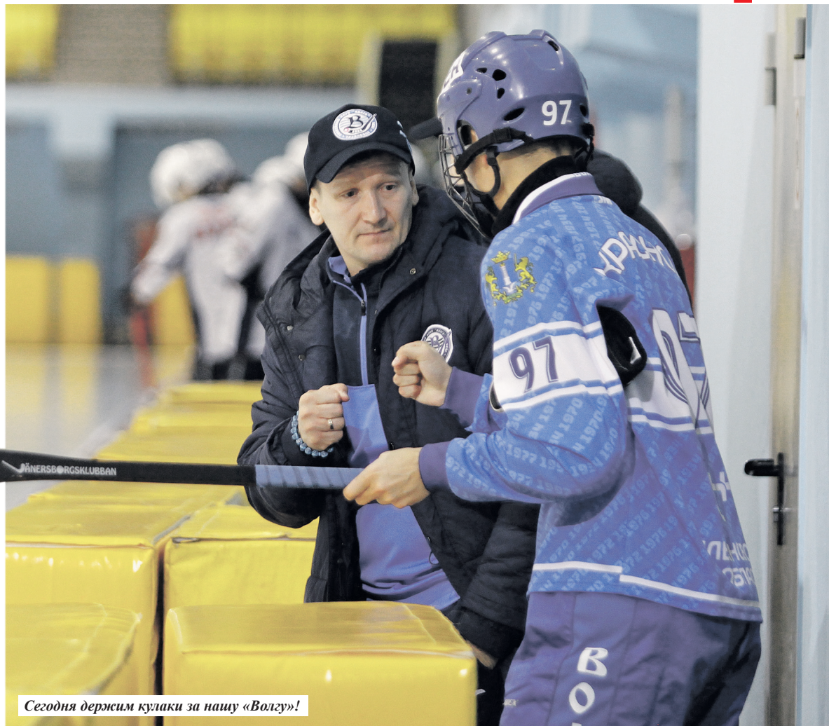
Сегодня держим кулаки за нашу «Волгу»!