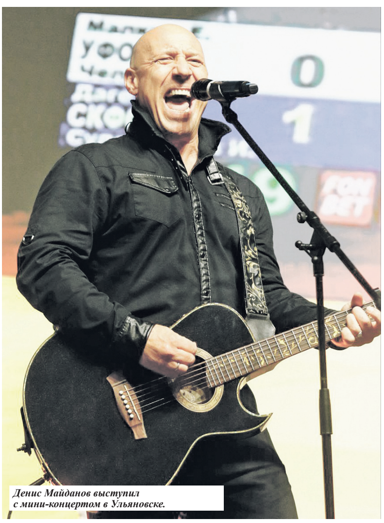
Денис Майданов выступил с мини-концертом в Ульяновске.