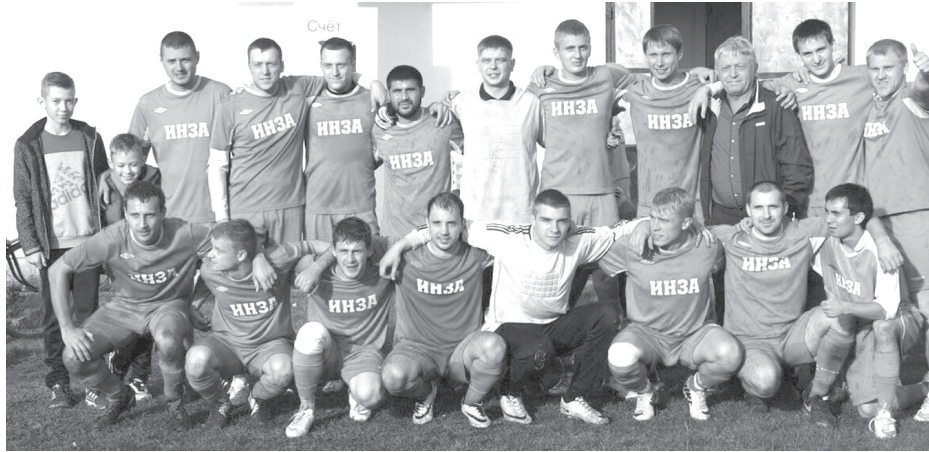
«Инза» - чемпион области двух последних лет.