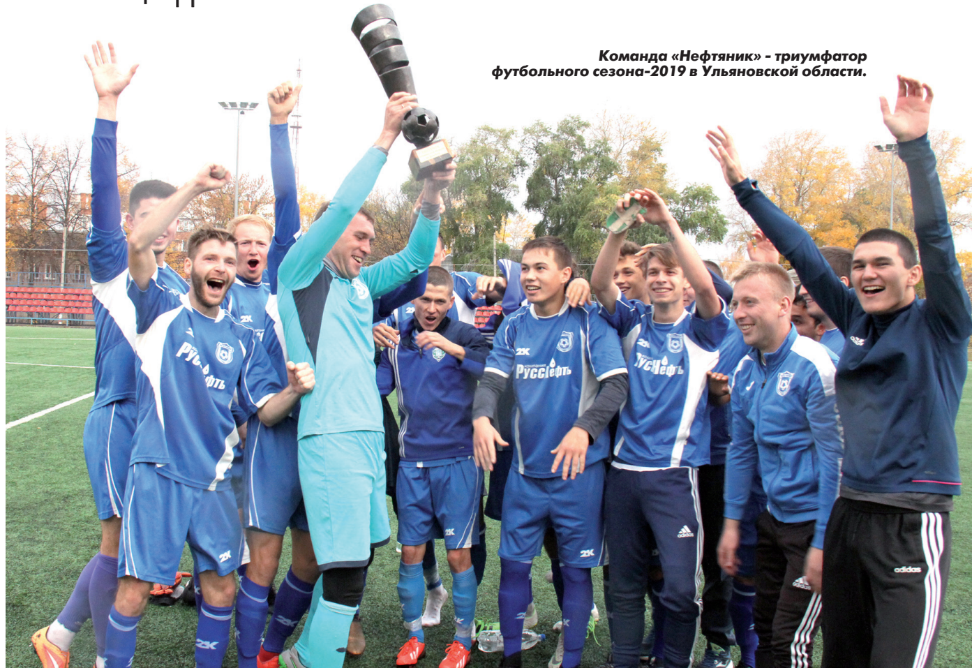
Команда «Нефтяник» - триумфатор футбольного сезона-2019 в Ульяновской области.

Региональный турнир-2019 стал историей. «ЧЕМПИОН» подсчитал главные цифры и составил итоговый отчет.