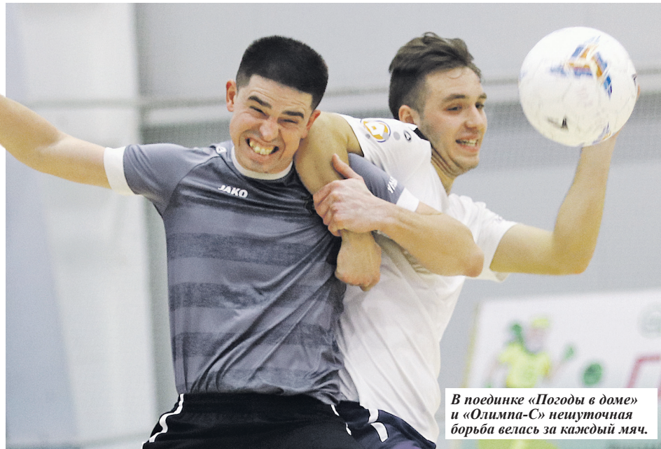
В поединке «Погоды в доме» и «Олимпа-С» нешуточная борьба велась за каждый мяч.

- Я считаю, мой гол психологически надломил соперников, но также было заметно, что они уже подустали, - поведаль после игры САПОЖНИКОВ. - Кроме того, на действиях «Кучины» сказалось отсутствие нескольких ключевых игроков. Мы всегда стараемся настра-