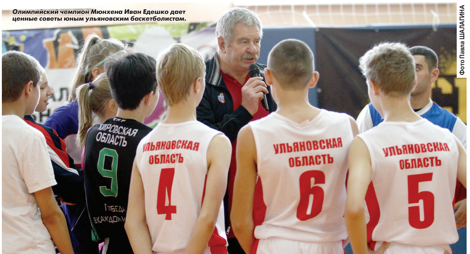
Олимпийский чемпион Мюнхена Иван Едешко дает ценные советы юным ульяновским баскетболистам.