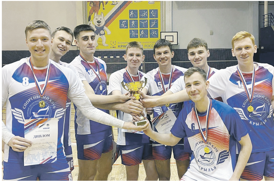
Вolleyболисты УИ ГА - многолетние лидеры областных универсиад.