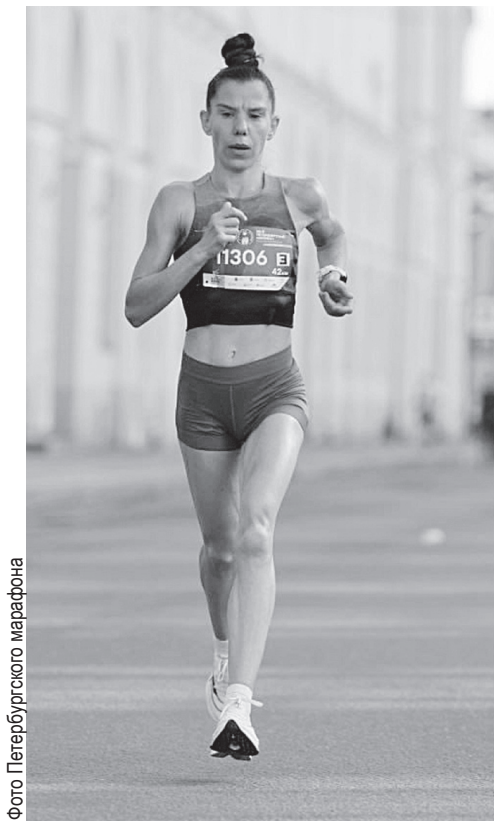
Фото Петербургского марафона