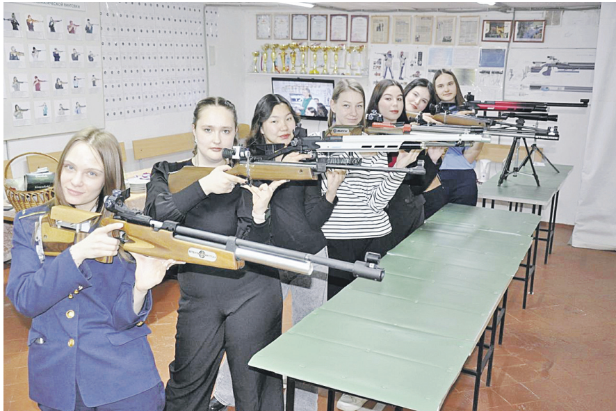
Женская сборная авиационного института умеет стрелять не только глазами.

семь лет подряд входит в число призеров. Причем три последних года будущие покровители неба финишируют вторыми, активно поджимая признанного лидера - УлГПУ. Отдельные виды программы по праву считаются коронными для авиационного института. Например, мужской турнир по волейболу его представители выигрывали семь раз подряд! Также последние годы курсантам нет равных в пулевой стрельбе. Причем как у юношей, так и у девушек. Плюс к тому «летчики» периодически «выстреливают» в футзале и баскетболе, жиме штанги лежа и бадминтоне, настольном теннисе, плавании и легкой атлетике. К слову, в этом году по итогам традиционной областной эстафеты на приз газеты «Ульяновская правда» беговая дружина УИ ГА впервые в своей истории заняла второе место среди вузов - в придачу к семи победам в зачете третьей группы (среди военных училищ).