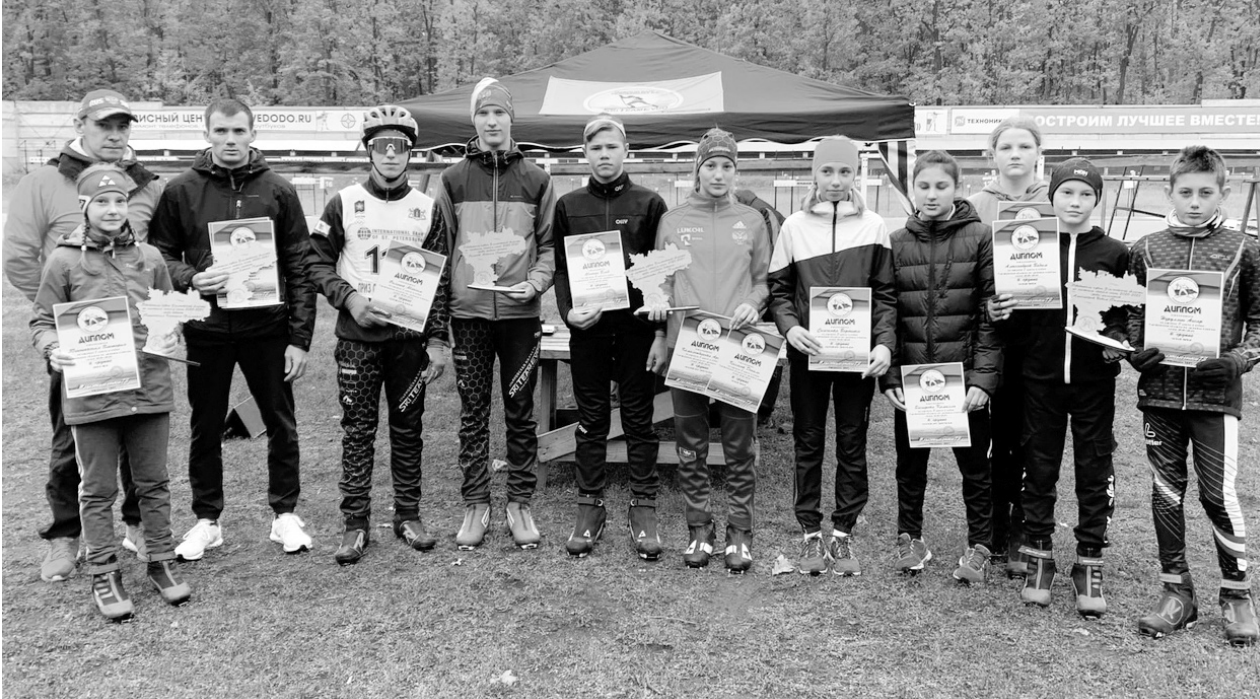
Лауреаты Кубка области 2020/2021 и в новом сезоне готовятся стать лучшими.

Лыжники региона, продолжающие подготовку к зимнему сезону, боролись за награды областных соревнований по лыжероллерам в рамках второго этапа Кубка ОФП.