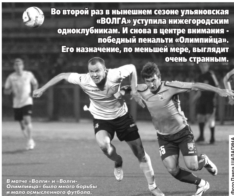
В матче «Волги» и «Волги-Олимпийца» было много борьбы и мало осмысленного футбола.

Предупреждения: Борисов, 43; Мухаметдинов, 65 - Хрипков, 22; Сорочкин, 35; Ершов, 48; Карасев, 90+2.