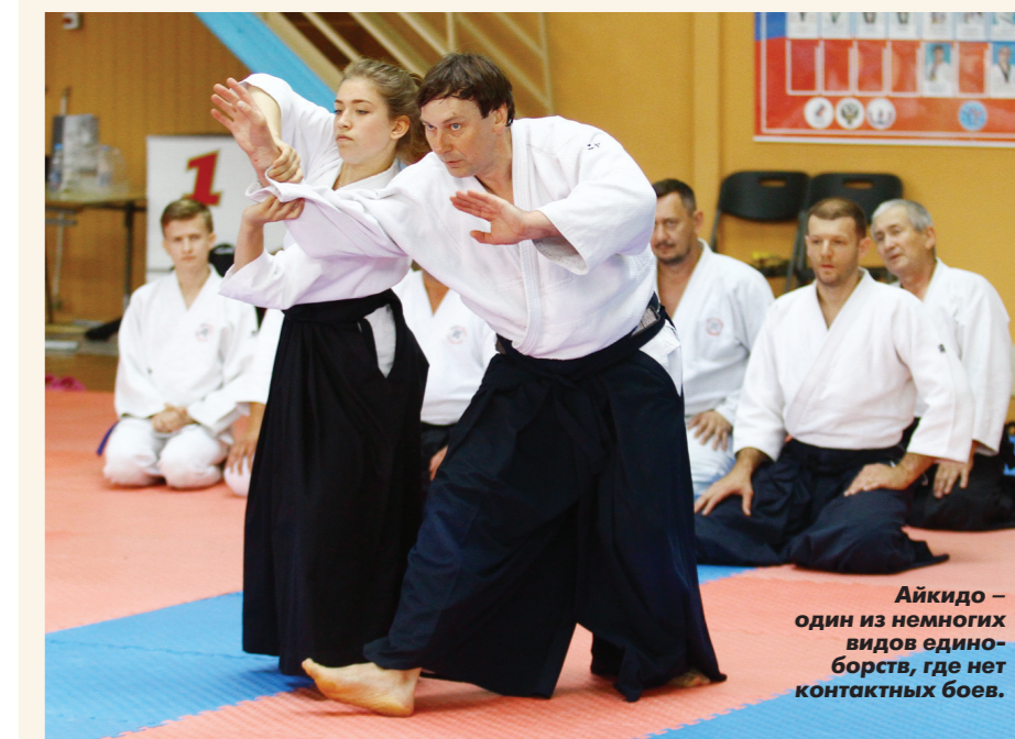
Айкудо – один из немногих видов единоборств, где нет контактных боев.

Поскольку участие в мероприятиях приняли члены судейских комитетов, руководители всемирных федераций. Как правило, ульяновским единоборцам приходится ехать в Москву или за границу, чтобы получить более высокую спортивную степень мастера. На сей раз аттестацию можно было пройти прямо во время фестиваля. Так, например, пять представителей федерации косики карате выполнили нормативы на черный пояс.