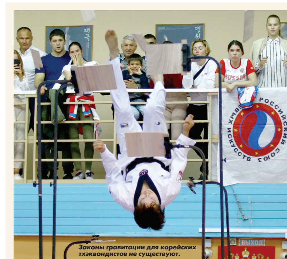
Законы гравитации для корейских тхэквондистов не существуют.