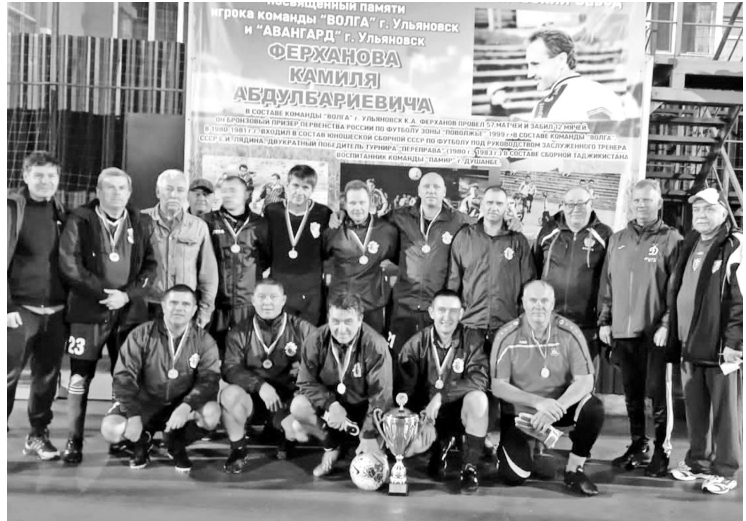
5 сентября 2023 года. Команда «Авангард» - победитель турнира памяти Камилы Ферханова, проведенного на призы Ульяновского механического завода.