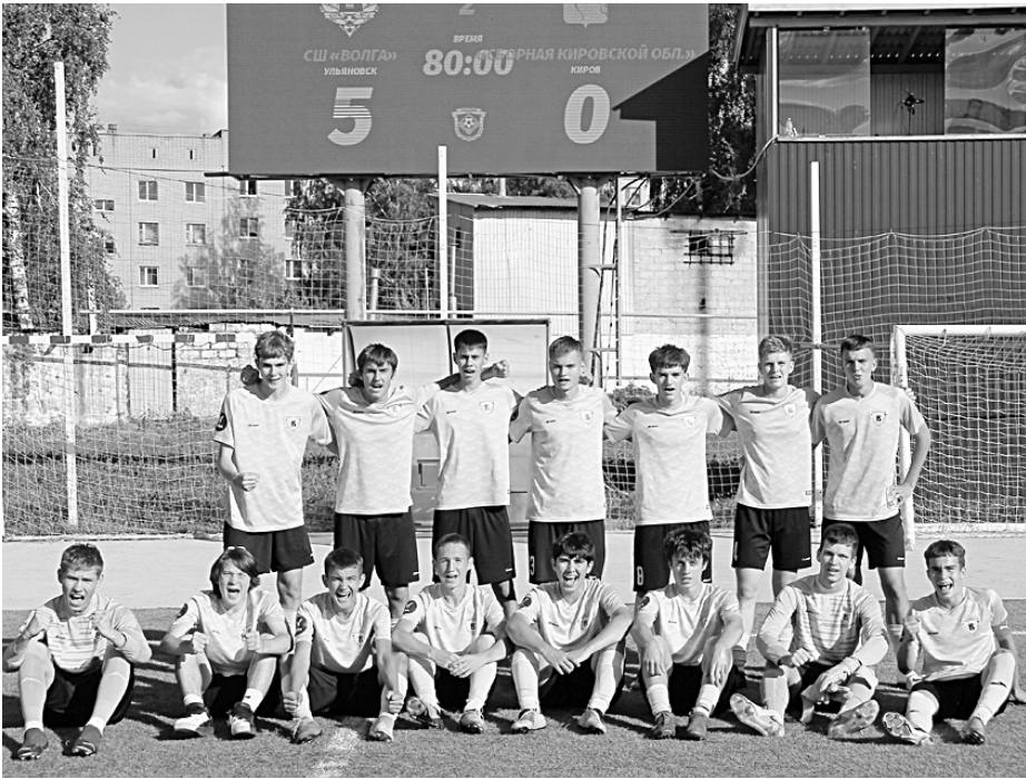
Футболисты «Волги-2008» забили больше всех на домашнем турнире и получили заслуженное «серебро».

С более приятным «багажом» в квартет сильнейших пробился «Атом». В своей группе команда из Димитровграда, усиленная футболистами «Университета», «всухую» обыграла саратовскую «СШОР-14-Волгу» (1:0) и «Смену-Базулюк» (2:0), а также ра-