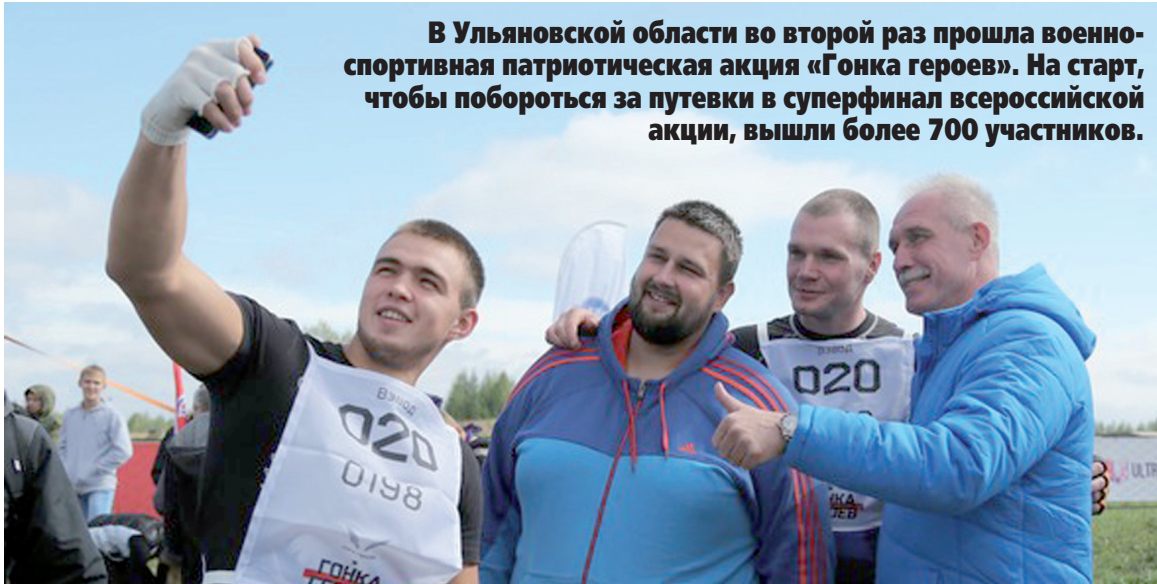
В Ульяновской области во второй раз прошла военно-спортивная патриотическая акция «Гонка героев». На старт, чтобы побороться за путевки в суперфинал всероссийской акции, вышли более 700 участников.