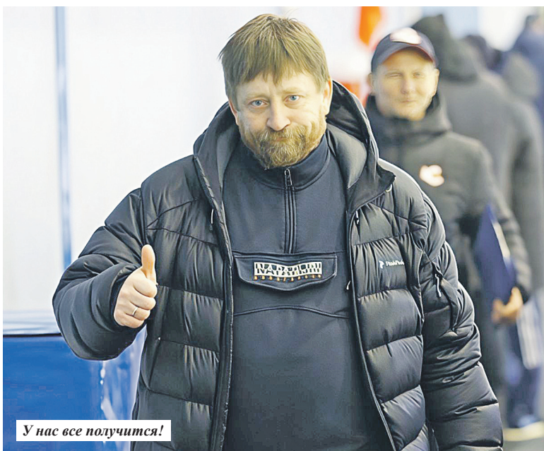
У нас все получится!