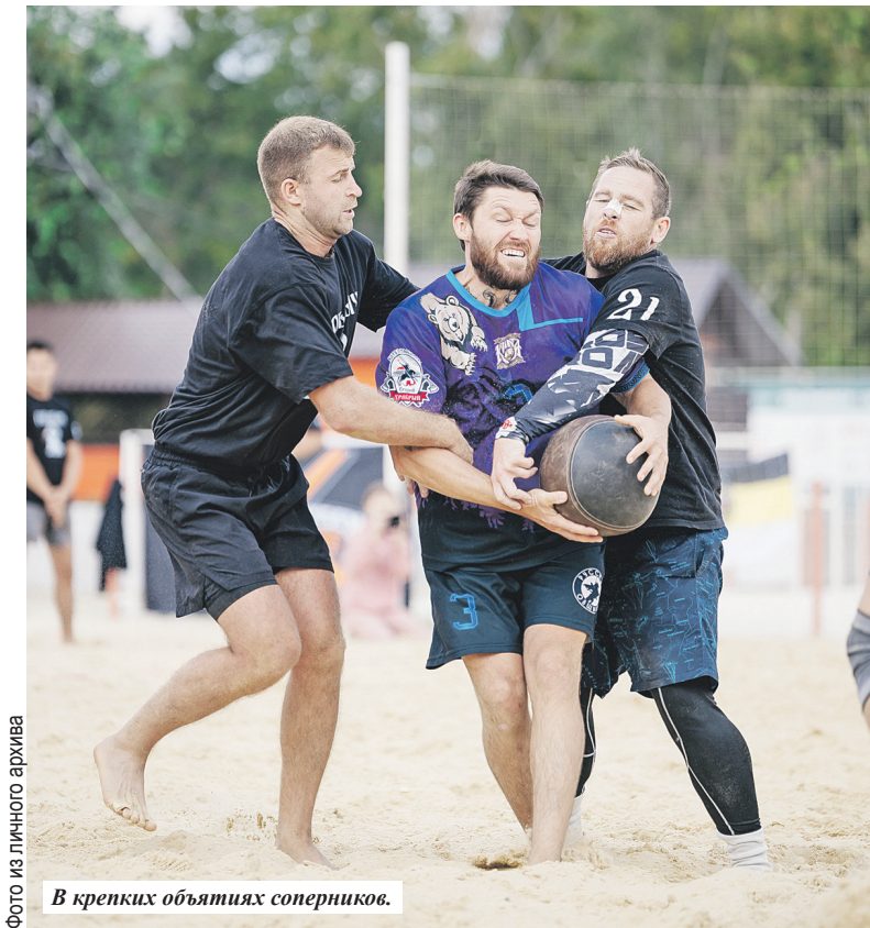
В крепких объятиях соперников.

На этом сезон в киле не завершается. Осенью ульяновцам предстоит участие в «Богатырской сече» - главном турнире по этому виду спорта, который пройдет 15 ноября в Москве.