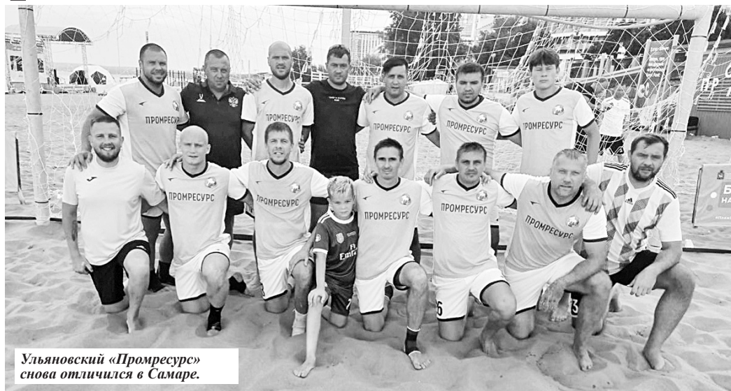
Ульяновский «Промресурс» снова отличился в Самаре.

Так получилось, что турнирные пути земляков пересеклись