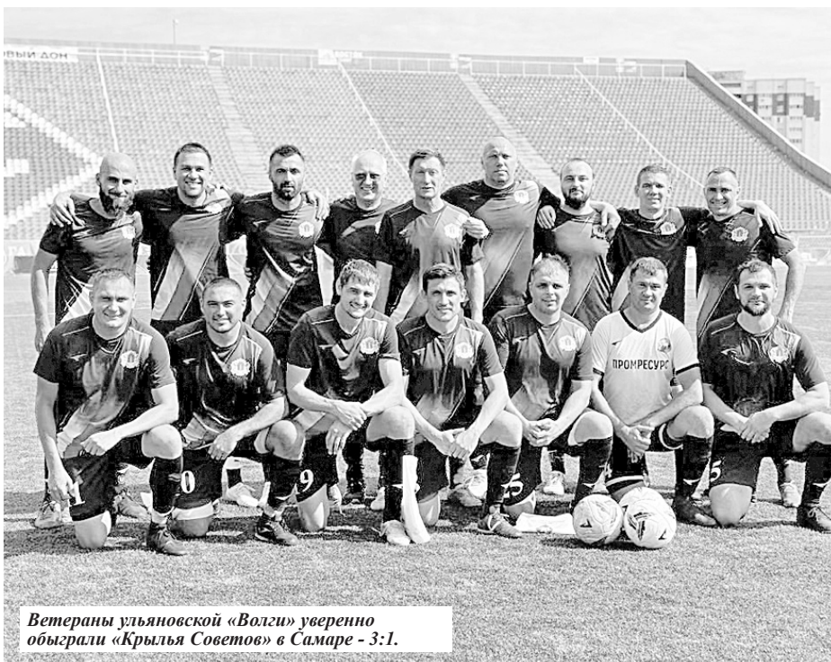
Ветераны ульяновской «Волги» уверенно обыграли «Крылья Советов» в Самаре - 3:1.