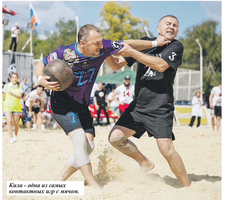
Кила - одна из самых контактных игр с мячом.

Игра в килу состоит из схваток (в значении тайма или периода). На одну схватку дается пять (для формата 3х3) или 10 минут («5х5»), при этом она может завершиться и быстрее, если одна из ватаг первой совершит три взятия города. Побеждает та сторона, которая выиграет две схватки. К слову, ничейных исходов в киле не бывает. Если ватаги имеют одинаковое количество взятий к исходу пятиминутки/десяти минутки, игра продолжается до первого зачетного действия. При равном количестве выигранных схваток назначается дополнительная, третья.