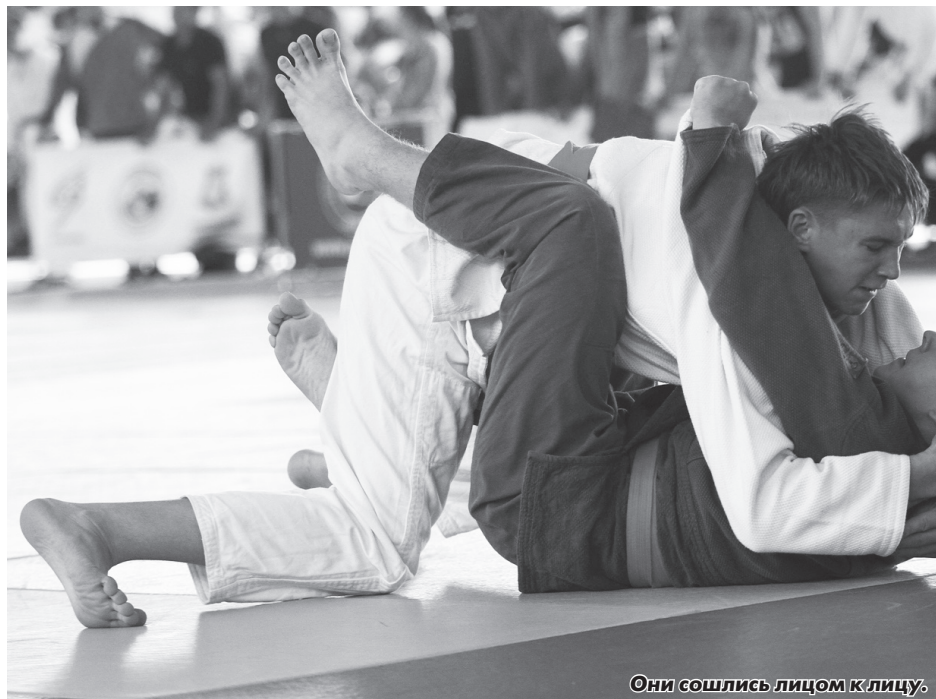
Они сошлись лицом к лицу.