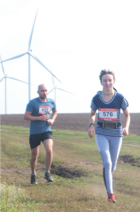
Во время пробега «Быстрее ветра» дул легкий, приятный для участников ветерок.

В командном зачете ульяновские рукоборцы заняли второе место Каждый из наших ребят готовится к другим, более ответственным стартам, - отметил тренер ульяновских армрестлеров