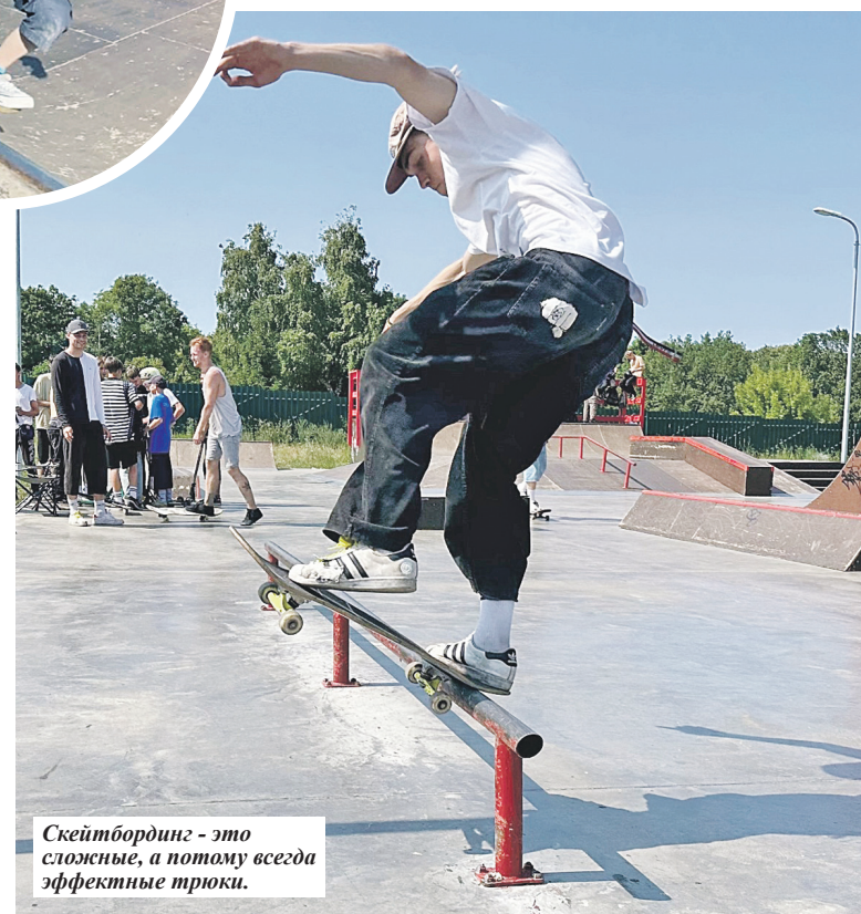
Скейтбординг - это сложные, а потому всегда эффективные трюки.

На сегодняшний день в областном центре насчитывается порядка 1 000 скейтбордистов. Ежегодно проводится по три официальных соревнования, на которые также выбираются димитровградские скейтеры. Кроме того, ульяновцы регулярно участвуют в выездных мероприятиях и фестивалях уличной культуры, таких как «Птичий базар» и «Пульс».