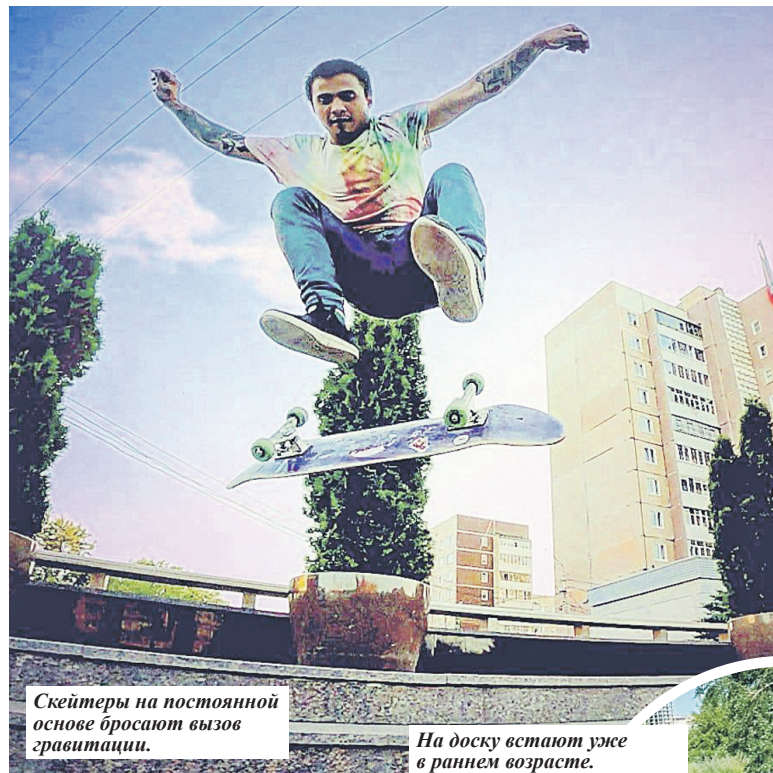
Скейтеры на постоянной основе бросают вызов гравитации.

Для скейтбординга как вида спорта, сопряженного с высоким риском падений, немаловажное значение имеет защитная экипировка. Дети до 18 лет в обязательном порядке должны ее использовать на официальных соревнованиях. Это прописано в регламентах. А вот у взрослых скейтеров отношение к «экипу» скорее нигилистическое.