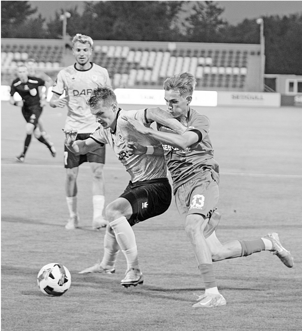
Футболисты «Чайки», несмотря на свою молодость, оказались неуступчивым соперником для волжан.

Бодрое начало как будто бы сулило интересное и приятное для болельщиков ульяновской команды продолжение. «Волга» доминировала на поле с уже привычным контролем мяча за 60 процентов. Однако следующий голевой момент у гостей возник только на исходе получаса игры. Уридия из убойной позиции в чужой штрафной зарядил куда-то в сторону со-