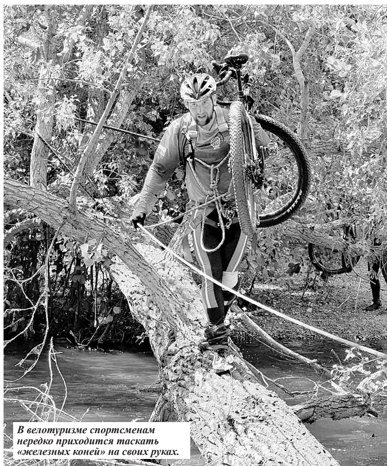
В велотуризме спортсменам нередко приходится таскать «железные коней» на своих руках.

спортивные вызовы готовы принять в будущем, к чему будете стремиться?